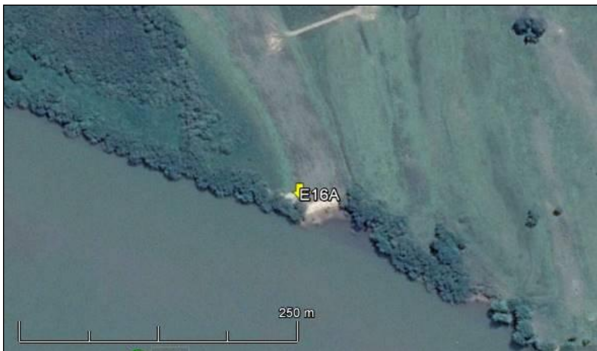
Figura 20: Imagem Google Earth, salientando o ponto amostral E16A (imagem de março de 2015, em situação de vazão normal do rio Jacuí).