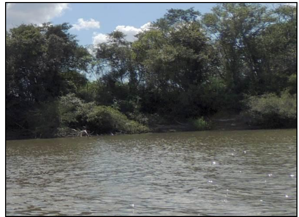
Foto 11: Vista da vegetação da margem, a jusante do ponto amostral E03.