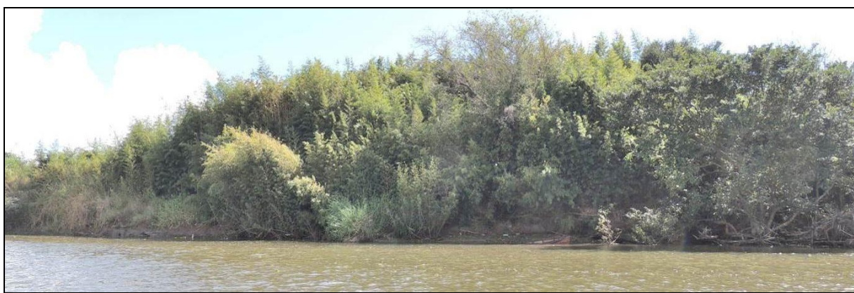
Foto 16: Vista geral da margem esquerda da Ilha da Paciência, em Triunfo, na posição do ponto amostral E04.

Não se verificou impactos diretos à vegetação arbórea nas áreas limítrofes, a não ser os decorrentes do pisoteio do gado. Em relação a estrutura e composição da vegetação ciliar, a situação não se alterou em relação ao período anterior.