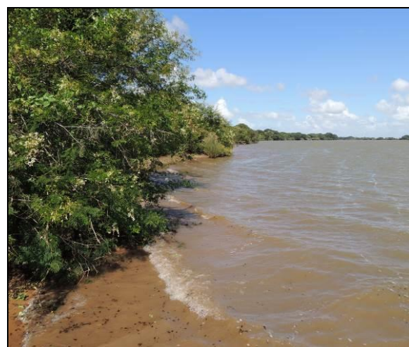
Foto 61: Vista da vegetação da margem, a jusante do ponto amostral E14A.