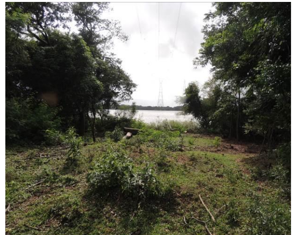
Foto 72: Local de supressão da mata ciliar para instalação das linhas de transmissão sem recuperação.