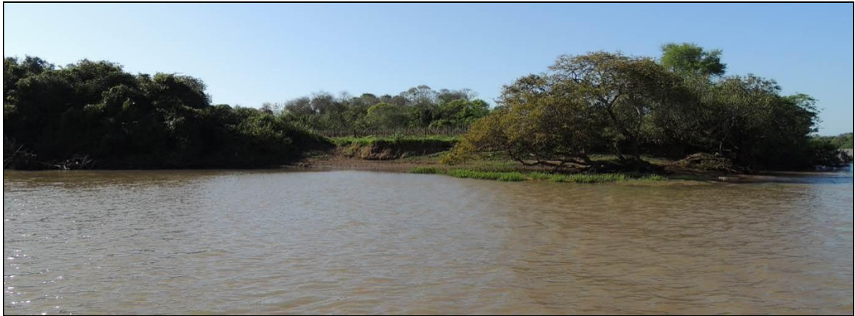
Foto 41: Vista geral da margem da ponta oeste da Ilha do Fanfa, em Triunfo, na posição do ponto amostral E11.