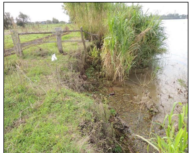
Foto 93: Vista da vegetação da margem, a jusante do ponto amostral E21.