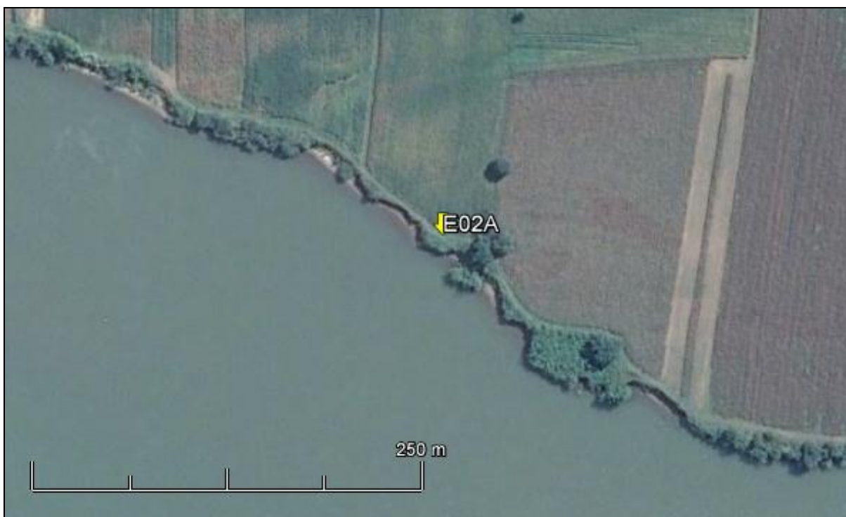
Figura 3: Imagem Google Earth, salientando o ponto amostral E02A (imagem de março de 2015, em situação de vazão normal do rio Jacuí).

ESPÉCIES PRINCIPAIS: Brachiaria plantaginea (brachiária), Sida rhombifolia (guanxuma), Pennisetum purpureum (capim-elefante), Senecio brasiliensis (flor-das-almas), Bidens pilosa (picão) e dos gêneros Gnaphalium sp., Cyperus sp. (tiriricas), Mimosa bimucronata (maricá) e Bambusa sp. (taquareira).