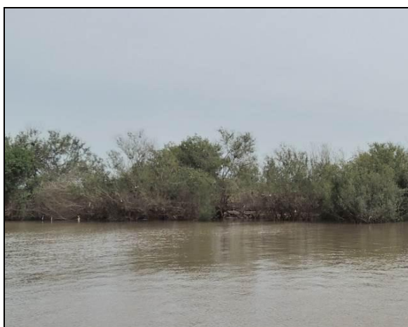
Foto 95: Vista da vegetação da margem, a montante do ponto amostral E23.