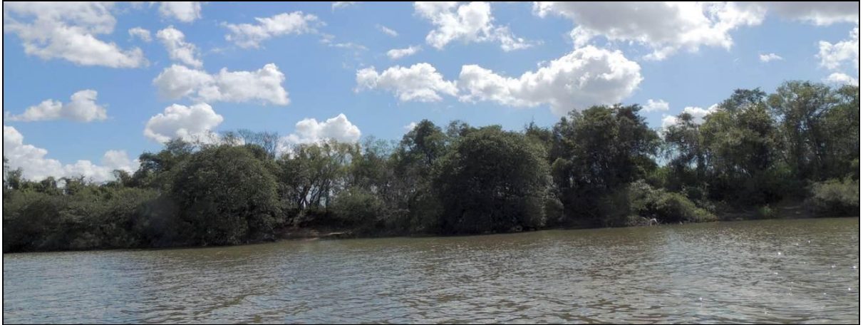
Foto 09: Vista geral da margem esquerda da Ilha da Paciência, em Triunfo, na posição do ponto amostral E03.