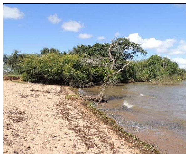
Foto 77: Vista da vegetação da margem, a jusante do ponto amostral E16A.