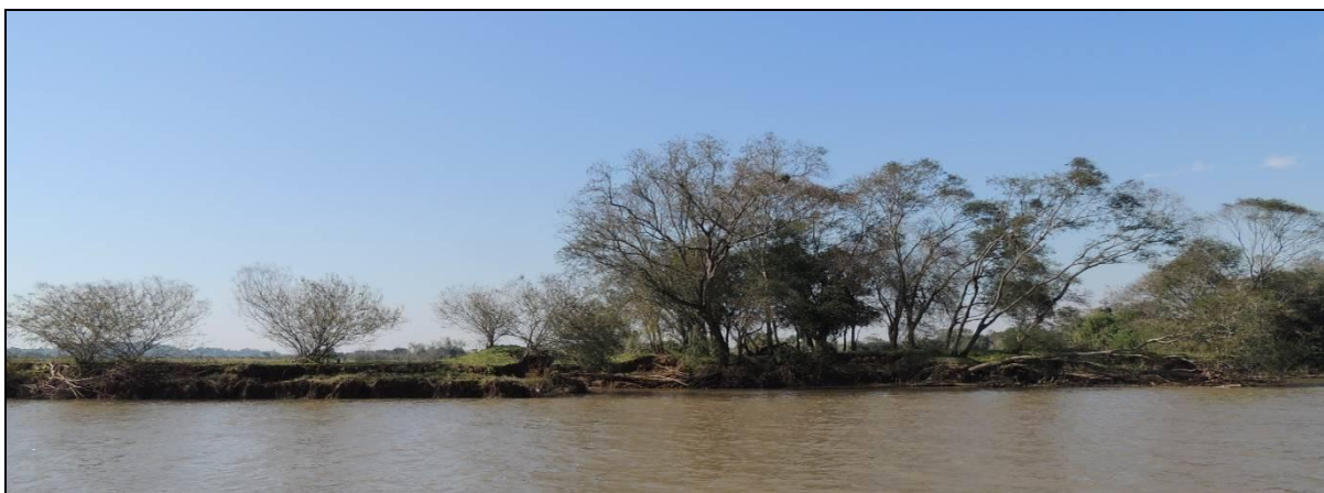
Foto 86: Vista geral da ponta oeste da Ilha do Fanfa, em Triunfo, na posição do ponto amostral E19A.

A APP está sendo utilizada intensivamente, com supressão total da vegetação original em alguns segmentos. A vegetação maior encontra-se estabilizada, não verificando-se diferença em relação ao período anterior, porém o sub-bosque é suprimido a cada acampamento ali feito. A vegetação do talude é rarefeita, verificando-se o recuo das margens, por desabamento.