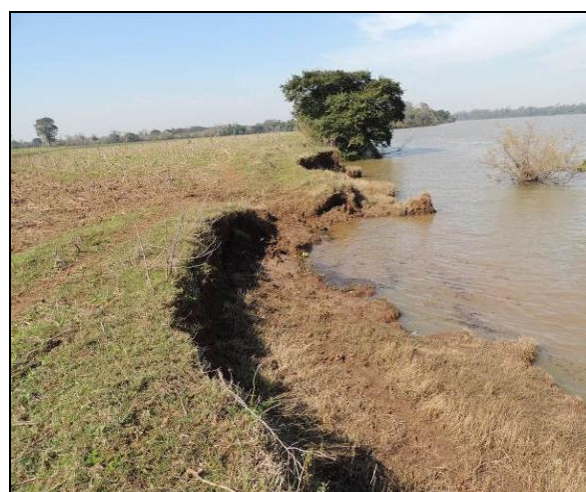
Foto 48: Vista da vegetação da margem, a jusante do ponto amostral E11A.