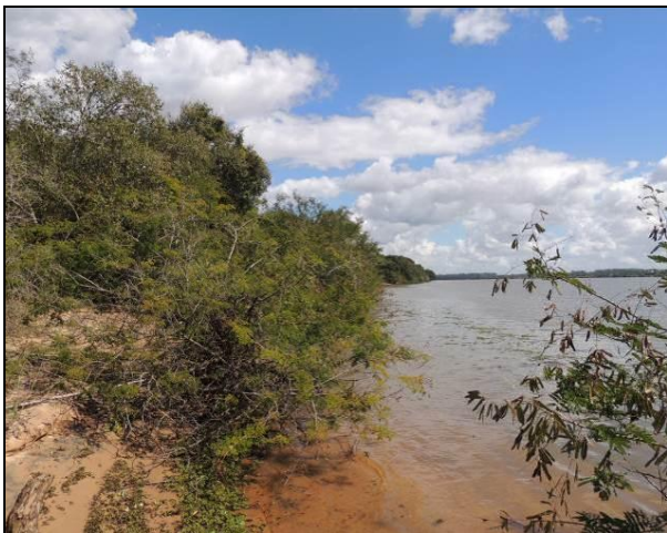
Foto 2: Vista da vegetação da margem, a montante do ponto amostral E01.