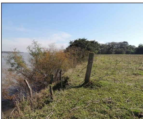
Foto 47: Vista da vegetação da margem, a montante do ponto amostral E11A.