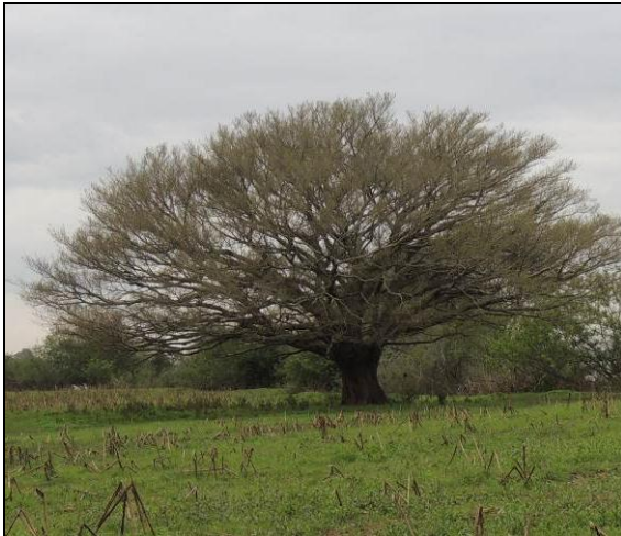
Foto 73: Figueira-folha-míuda distante 240 m do ponto para leste, em meio a lavoura de milho.