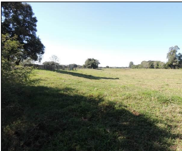
Foto 81: Vista do interior da ilha, onde salientam-se atividades agropastoris.