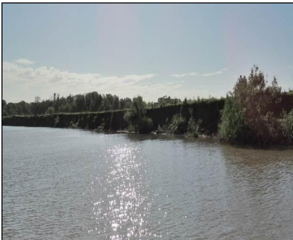
Foto 42: Vista da vegetação da margem, a montante do ponto amostral E11.