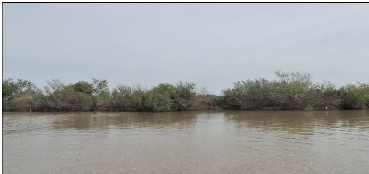
Foto 94: Vista geral da ponta oeste da Ilha do Araújo, em Triunfo, na posição do ponto amostral E23.