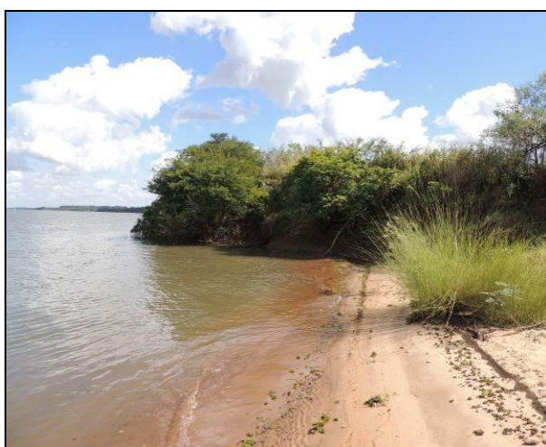
Foto 05: Vista da vegetação da margem, a montante do ponto amostral E02A.