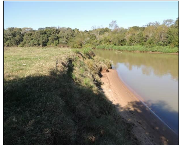
Foto 80: Vista da vegetação da margem, a jusante do ponto amostral E17.