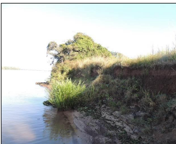
Foto 50: Vista da vegetação da margem, a montante do ponto amostral E12A.