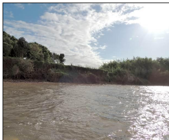
Foto 18: Vista da vegetação da margem, a jusante do ponto amostral E04.