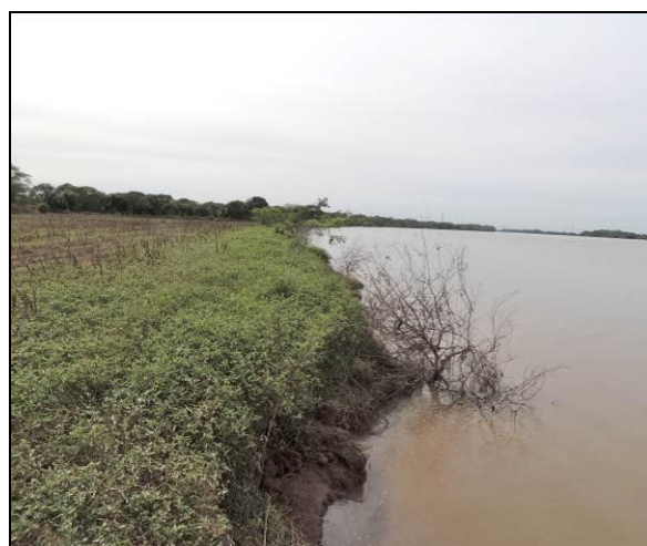
Foto 64: Vista da vegetação da margem, a jusante do ponto amostral E14B.