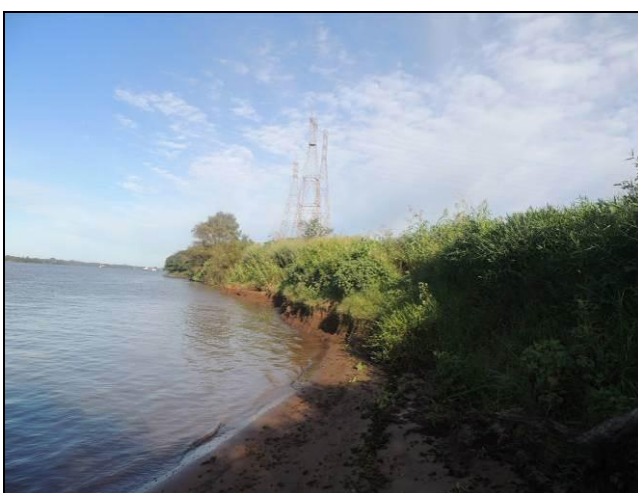
Foto 28: Vista da vegetação da margem, a montante do ponto amostral E07A.