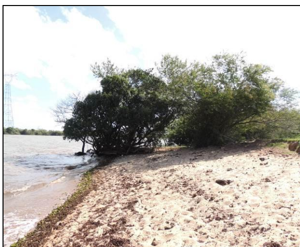
Foto 76: Vista da vegetação da margem, a montante do ponto amostral E16A.