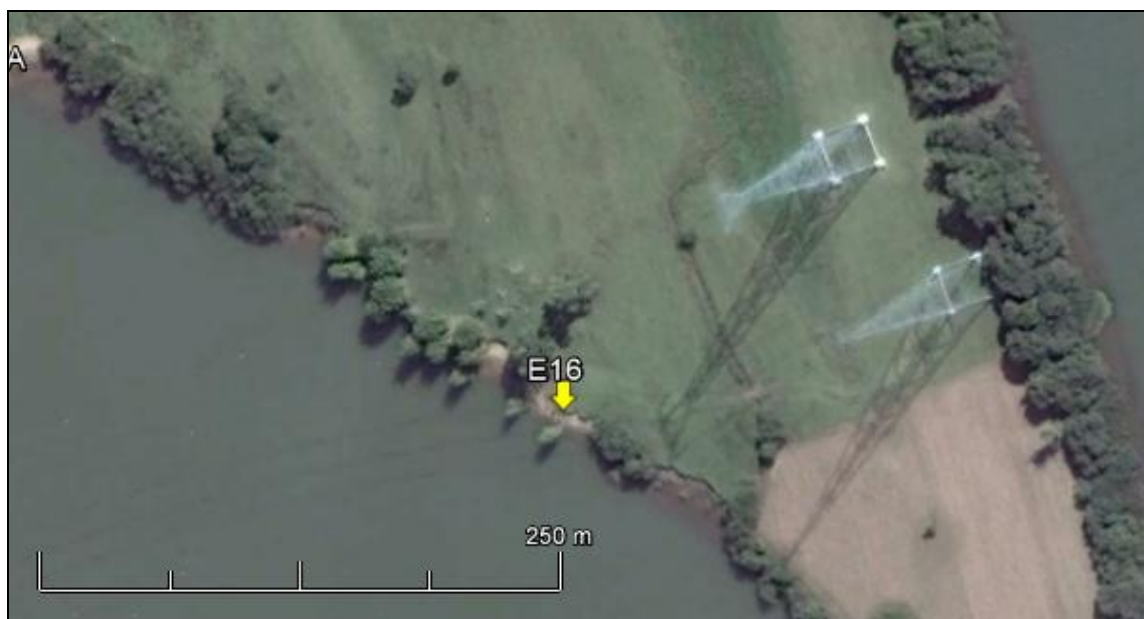
Figura 19: Imagem Google Earth, salientando o ponto amostral E16 (imagem de março de 2015, em situação de vazão normal do rio Jacuí).

ESPÉCIES PRINCIPAIS: Das poucas árvores, são predominantes o ingá-de-beira-de-rio ( Ingá uruguensis ) e o maricá. Existem também próximo ao ponto figueiras-folha-miuda e dois jerivás. Citando a vegetação exótica há exemplares de eucalipto e taquareiras. Na vegetação herbácea e arbustiva destacam-se Senecio brasiliensis (flor-das-almas), Sida rhombifolia (guanxuma), Axonopus compressus (grama-missioneira), Cynodon dactylon (grama-seda), Elephantopus mollis (pé-de-elefante), Vernonia nudiflora (alecrim-do-campo), além de outras espécies pertencentes principalmente às famílias Asteraceae, Poaceae, Cyperaceae, Solanaceae e Fabaceae.