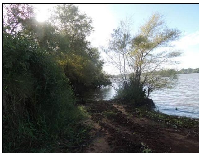
Foto 29: Vista da vegetação da margem, a jusante do ponto amostral E07A.