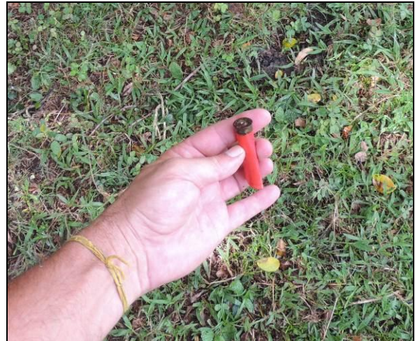
Foto 74: Foram encontrados vários cartuchos de bala na área das torres, denunciando ações de caça ilegal na área.