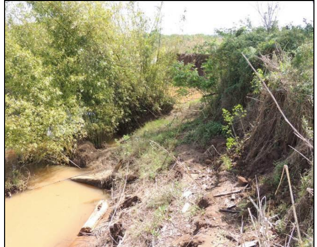
Foto 08: Detalhe da conformação da margem e da vegetação ciliar, próximo ao ponto amostral E02A.