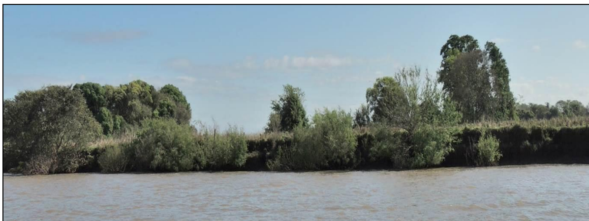
Foto 46: Vista geral da margem direita da Ilha do Fanfa, em Triunfo, na posição do ponto amostral E11A.

O Marco Geodésico foi implantado em 02/2014 e o Ponto de Monitoramento foi ativado em 2015. Observou-se moderado recuo das margem durante este período. Constatou-se a presença do gado utilizando as margens para beber água, o que aumenta a remobilização de material. A APP está sendo utilizada intensivamente, com supressão total da vegetação original. A mata ciliar foi suprimida para dar lugar à pastagem e lavoura. A margem se apresenta como um talude contínuo de até 2 metros de altura, que está sendo constantemente erodido.