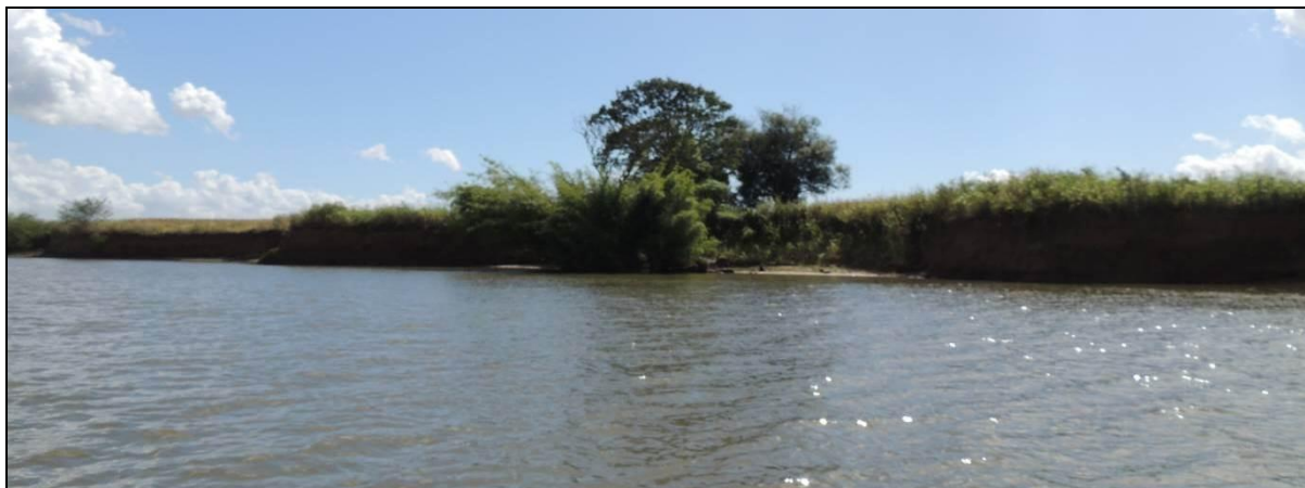
Foto 04: Vista geral da margem esquerda da Ilha da Paciência, em Triunfo, na posição em frente do ponto amostral E02A.

porte representa ao recuo das margens. Entretanto pode-se constatar que a vegetação arbórea está sendo desestabilizada, com exposição de raízes e tombamento das touceiras de taquara sobre a água. A APP está sendo utilizada intensivamente, com supressão quase total da vegetação original.