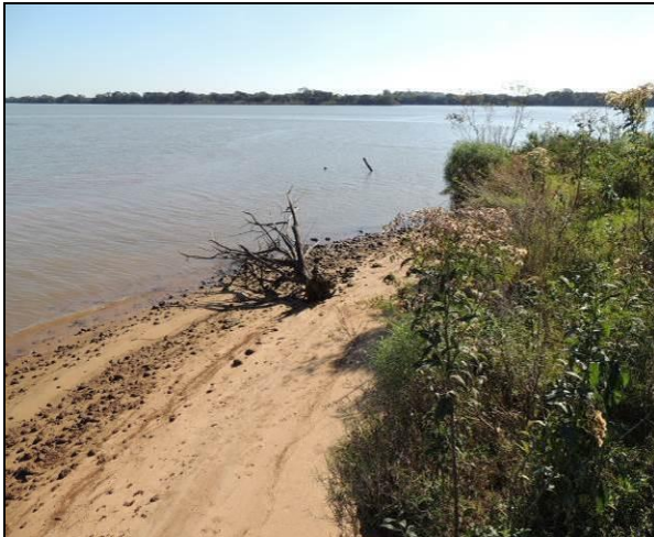
Foto 55: Vista da vegetação da margem, a montante do ponto amostral E13.