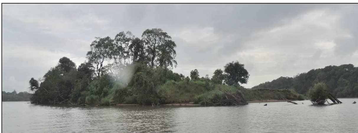
Foto 78: Vista geral da ponta oeste da Ilha do Carioca, em Triunfo, na posição do ponto amostral E17.

Fora da área cercada o gado invade a mata para se abrigar e acaba se alimentando dos indivíduos arbóreos jovens, impedindo o desenvolvimento do sub-bosque, causando assim o desaparecimento da mata. Foram registradas epífitas das famílias Bromeliacea e Cactaceas.