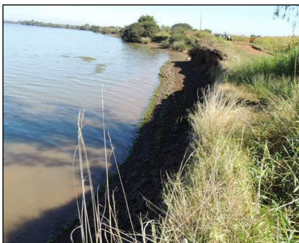
Foto 37: Vista da vegetação da margem, a montante do ponto amostral E10A.