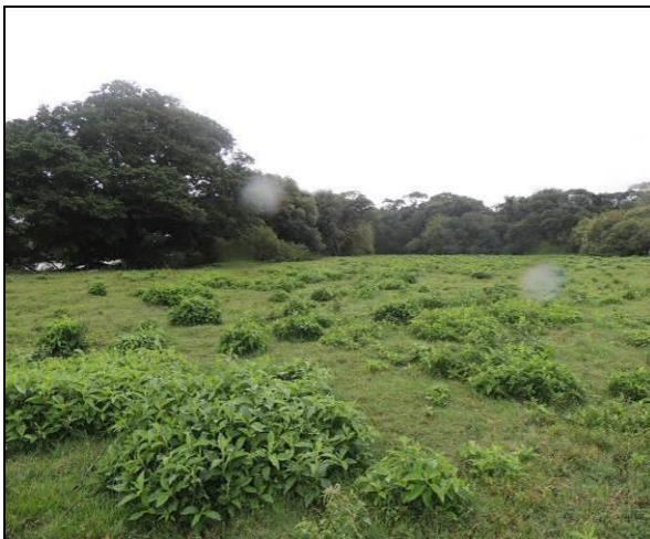
Foto 57: Aspecto do interior da ilha, em área próxima do ponto amostral E13.