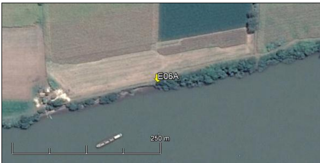
Figura 07: Imagem Google Earth, salientando o ponto amostral E06A (imagem de março de 2015, em situação de vazão normal do rio Jacuí).