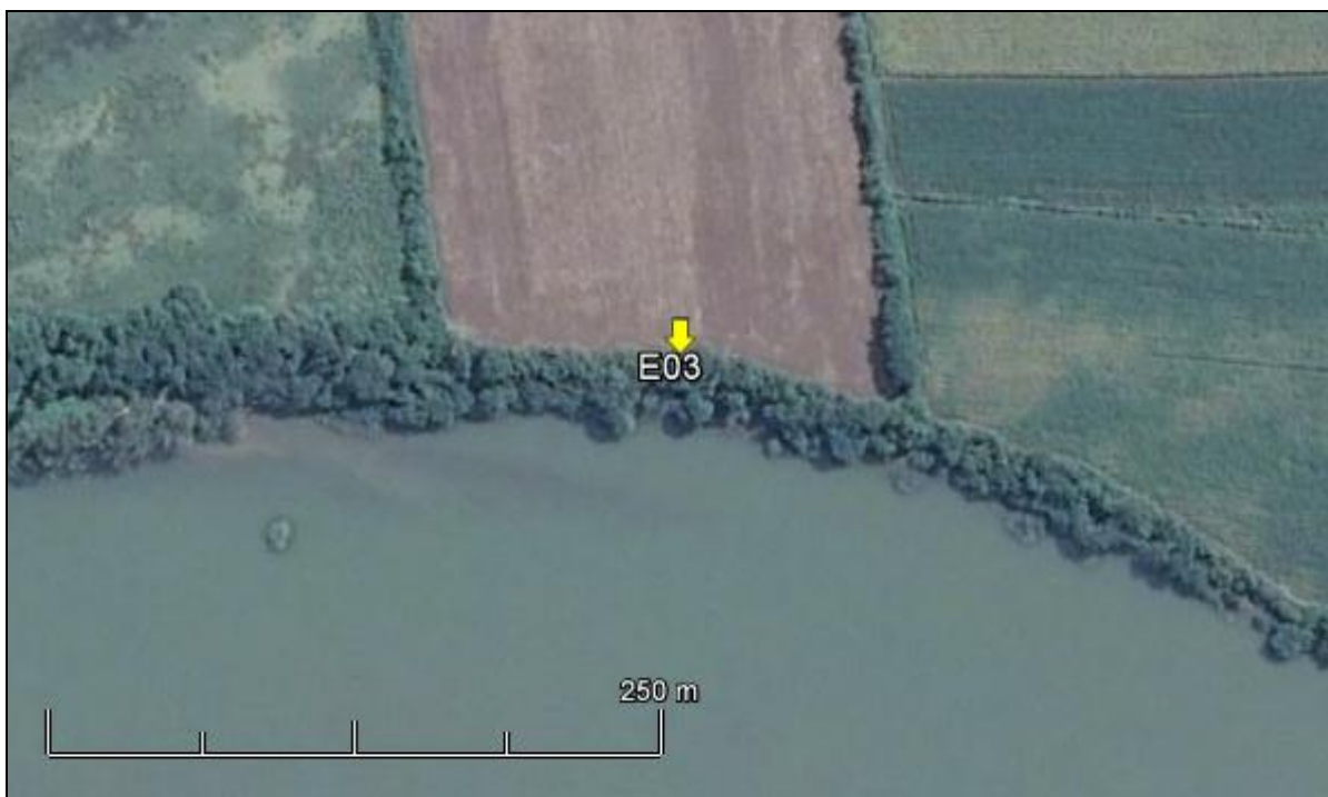
Figura 4: Imagem Google Earth, salientando o ponto amostral E03 (imagem de março de 2015, em situação de vazão normal do rio Jacuí)