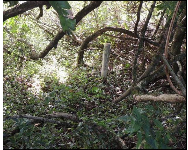
Foto 53: Vista de fragmento remanescente da mata ciliar, em área próxima ao ponto amostral E12A.