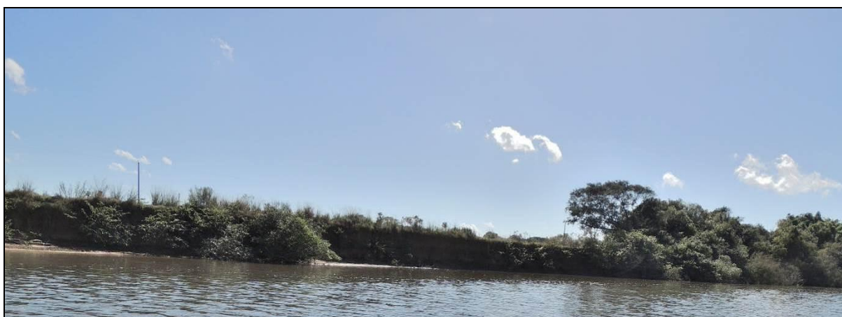
Foto 24: Vista geral da margem esquerda da Ilha da Paciência, em Triunfo, na posição do ponto amostral E06A.

A cobertura vegetal das margens não apresentou alterações em termos de estrutura e composição, não havendo indícios de regeneração natural da mata ciliar. Observou-se, por outro lado, leve recuo das margens, com queda de barranco e acúmulo de material na base deste.