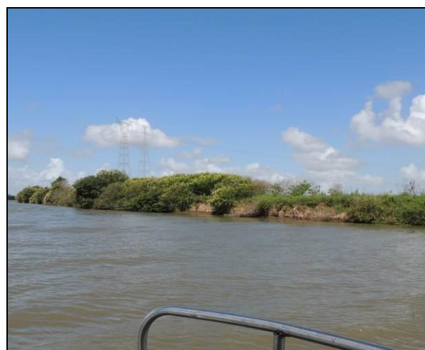
Foto 67: Vista da vegetação da margem, a jusante do ponto amostral E15.