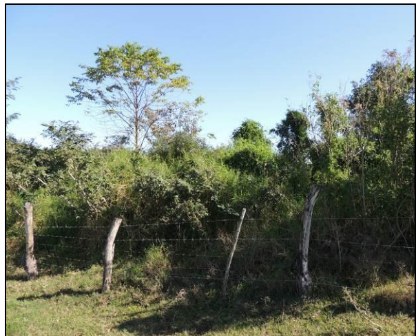
Foto 82: Local cercado onde pode-se recuperar a mata ciliar, observando-se exemplares de árvores nativas plantadas e que atingiram cerca de 3 m de altura.