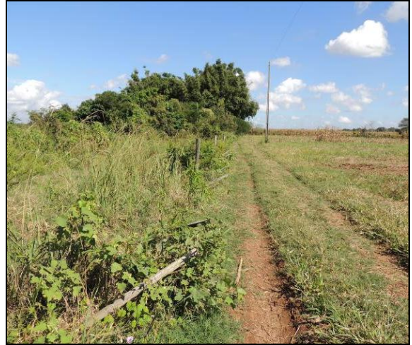
Foto 20: Detalhe do caminho de acesso à lavoura e o limite do plantio de mudas nativas executado na APP pelo proprietário.