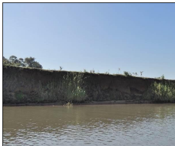
Foto 85: Vista da vegetação da margem, a jusante do ponto amostral E18B.