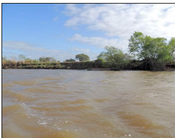
Foto 31: Vista da vegetação da margem, a montante do ponto amostral E08.