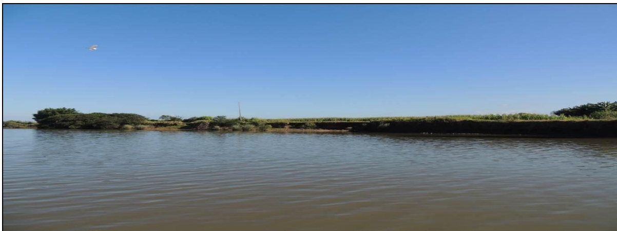
Foto 36: Vista geral da margem esquerda do rio Jacuí, na Praia Gen. Neto, em Triunfo, na posição do ponto amostral E10A.

carreamento de solo das barrancas. O processo erosivo atua livre de qualquer resistência, pois a mata ciliar foi totalmente suprimida.