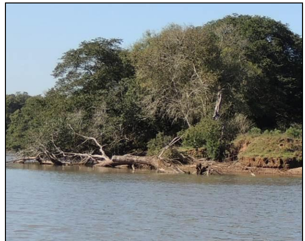
Foto 58: Árvores nativas de grande porte, tombadas próxima do ponto amostral E13.