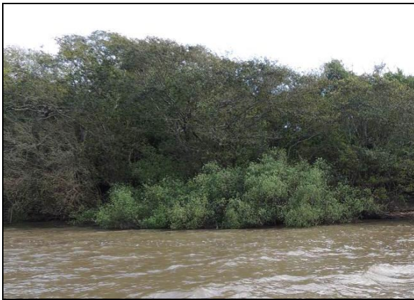
Foto 10: Vista da vegetação da margem, a montante do ponto amostral E03.