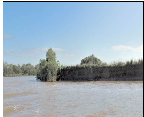
Foto 43: Vista da vegetação da margem, a jusante do ponto amostral E11.