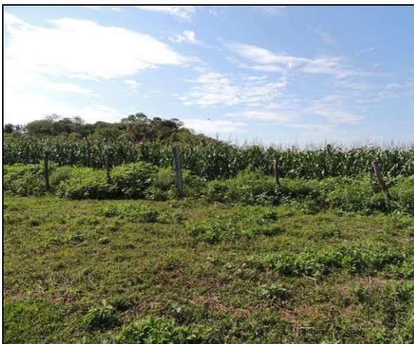
Foto 44: Vista da ocupação do interior da ilha, em local próximo ao ponto amostral E11.