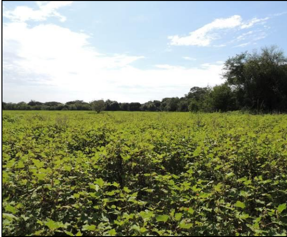
Foto 89: Vista do interior da ilha, onde salientam-se atividades agropastoris.