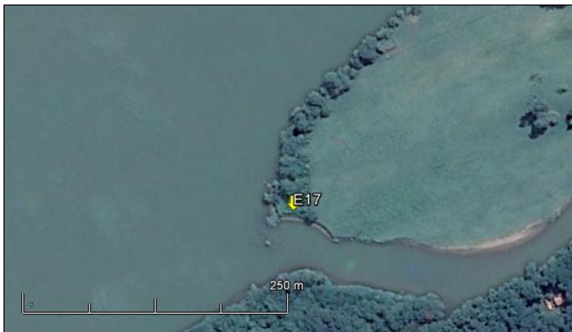
Figura 21: Imagem Google Earth, salientando o ponto amostral E17 (imagem de março de 2015, em situação de vazão normal do rio Jacuí).

ESPÉCIES PRINCIPAIS: Dentre as ervas predominam espécies das famílias Poaceae e Asteraceae, como Axonopus compressus (grama-missioneira), Cynodon dactylon (grama-seda), Elephantopus mollis (pé-de-elefante), Brachiaria sp (Braquiária) Vernonia nudiflora (alecrim-do-campo) e Baccharis articulata (carqueja). As espécies arbóreas que ocorrem são maricás ( Mimosa bimucronata ), Pouteria sp. (sarandís), Ingá uruguensis (ingá), Luehea divaricata (açoita cavalo), Casearia sylvestris (chá-de-bugre) e Ficus organensis (figueira).