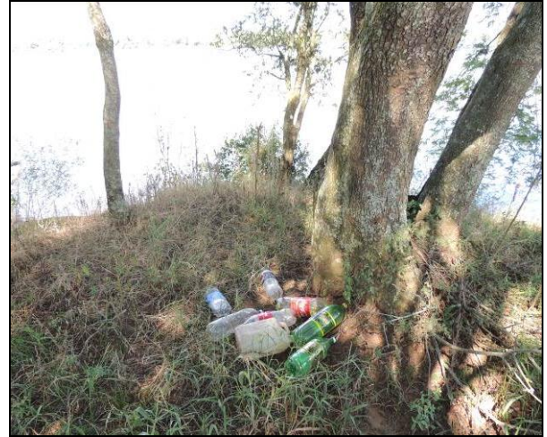
Foto 90: Acúmulo de lixo deixado nos acampamentos dentro da mata ciliar.