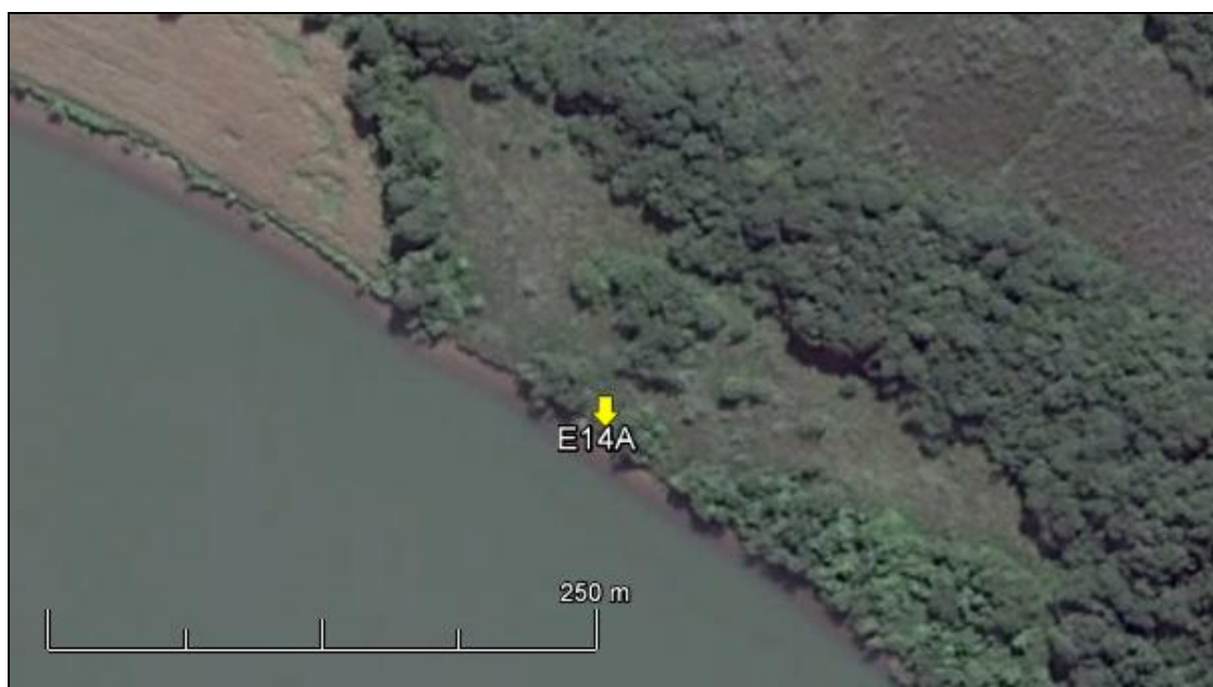
Figura 16: Imagem Google Earth, salientando o ponto amostral E14A (imagem de março de 2015, em situação de vazão normal do rio Jacuí).

ESPÉCIES PRINCIPAIS: Espécies das famílias Poaceae, Cyperaceae, Solanaceae e Asteraceae, com destaque para as rizomatosas Axonopus compressus (grama-missioneira) e Paspalum notatum (grama) rentes ao solo. Juntamente com as espécies: Solanum diflorum (peloteira), Senecio brasiliensis (flor-das-almas), Solanum atripurpureum (joá-roxo) e espécies dos gêneros Cyperus sp. (tiriricas), Sisyrinchium sp. e Desmodium sp. (pega-pega). As árvores e arvoretas estão representadas principalmente pelas espécies Pouteria salicifolia (sarandi-mata-olho), Ingá uruguensis (ingá-banana), Aloysia gratissima (erva-santa) e Daphnopsis racemosa (embira).