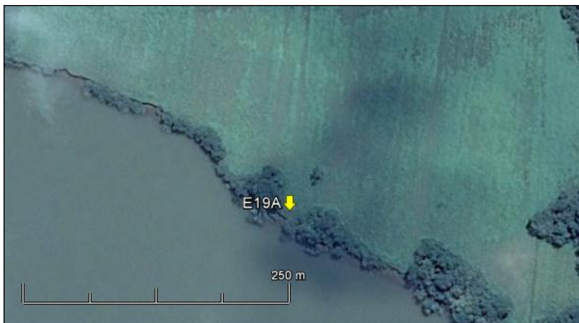
Figura 23: Imagem Google Earth, salientando o ponto amostral E19A (imagem de março de 2015, em situação de vazão normal do rio Jacuí).

ESPÉCIES PRINCIPAIS: Espécies herbáceas das famílias Poaceae, Cyperaceae, Solanaceae e Asteraceae, com destaque para as rizomatosas Axonopus compressus (grama-missioneira) e Paspalum notatum (grama) rentes ao solo. Espécies de árvores e arvoretas como: Parapiptadenia rigida (anjico), Ingá uruguensis (ingá), Bauhinia forficata (pata-de-vaca), Allophyllus edulis (chal-chal).