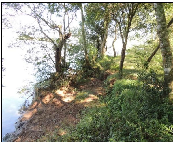
Foto 87: Vista da vegetação da margem, a montante do ponto amostral E19A.