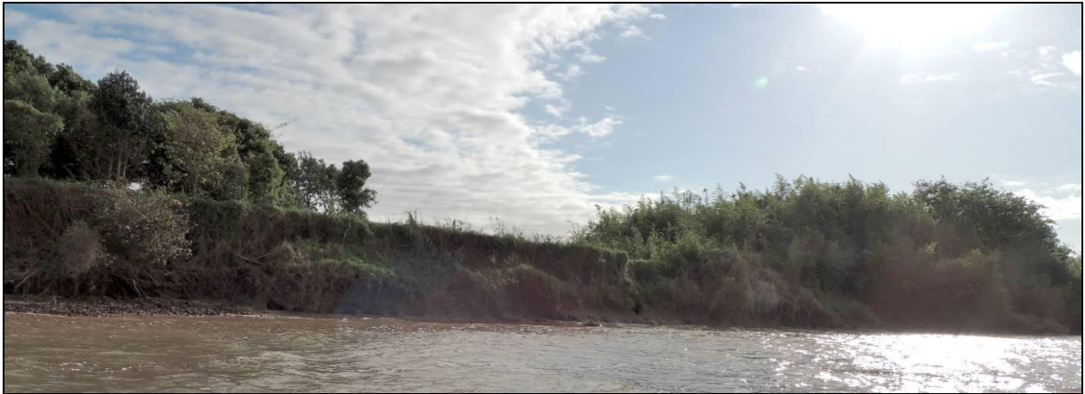
Foto 91: Vista geral da ponta oeste da Ilha da Paciência, em Triunfo, na posição do ponto amostral E21.