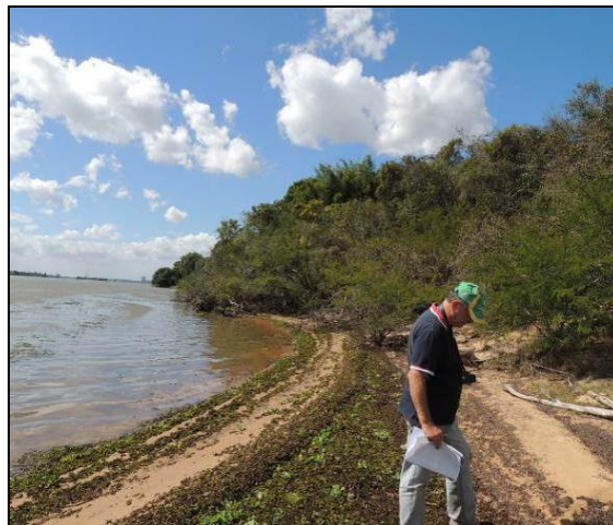
Foto 3: Vista da vegetação da margem, a jusante do ponto amostral E01.