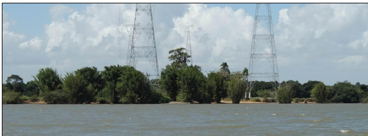
Foto 68: Vista geral da margem esquerda da Ilha do Araujo, em Triunfo, na posição do ponto amostral E16.

Durante os eventos severos de enchentes ocorridos no ano de 2015 (especialmente em outubro), verificou-se que praticamente toda a ilha das Cabras esteve submersa, sujeita à ação das correntezas. Com isso, verificou-se que nas áreas menos protegidas por vegetação mais complexa, os processos erosivos foram mais severos.