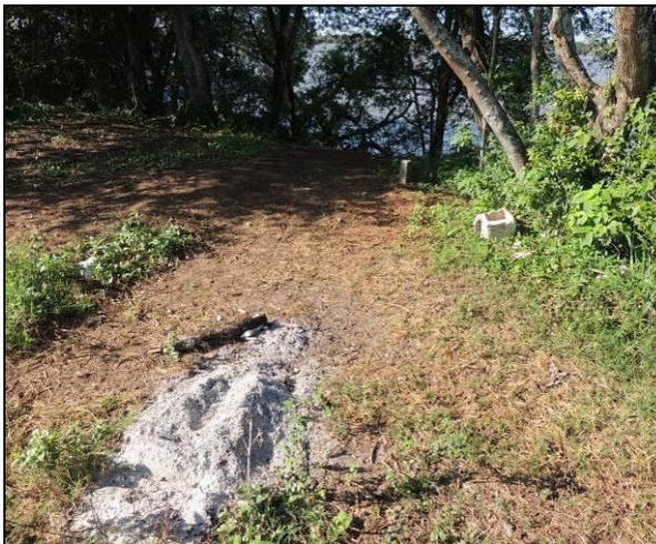
Foto 14: Vestígios de acampamento e depósito de lixo, próximo ao do ponto amostral E03.