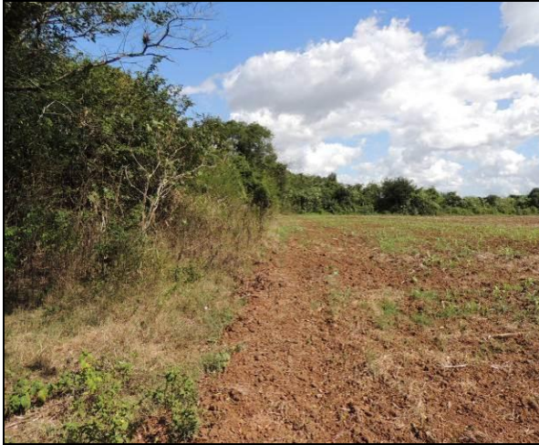
Foto 12: Aspecto da ocupação do interior da ilha, próximo ao ponto amostral E03.