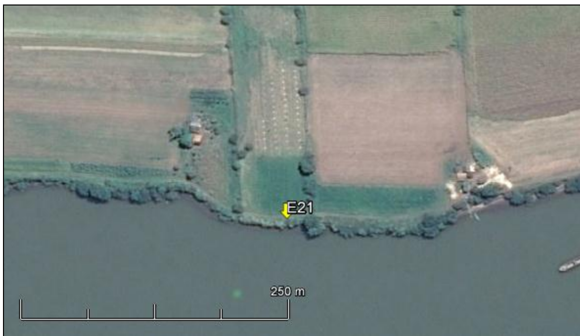
Figura 24: Imagem Google Earth, salientando o ponto amostral E21 (imagem de março de 2015, em situação de vazão normal do rio Jacuí).