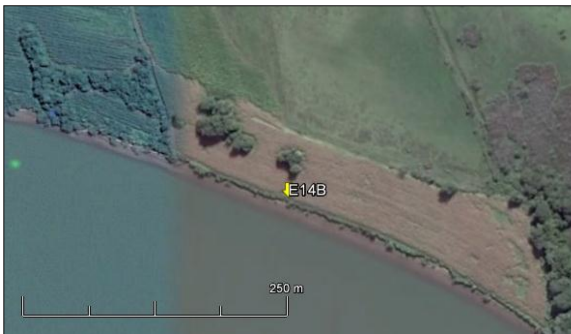
Figura 17: Imagem Google Earth, salientando o ponto amostral E14B (imagem de março de 2015, em situação de vazão normal do rio Jacuí).

ESPÉCIES PRINCIPAIS: Espécies das famílias Poaceae, Cyperaceae, Solanaceae e Asteraceae, com destaque para as rizomatosas Axonopus compressus (grama-missioneira) e Paspalum notatum (grama) rentes ao solo. Juntamente com as espécies: Solanum diflorum (peloteira), Senecio brasiliensis (flor-das-almas), Solanum atripurpureum (joá-roxo) e espécies dos gêneros Cyperus sp. (tiriricas), Sisyrinchium sp. e Desmodium sp. (pega-pega). As árvores e arvoretas estão representadas principalmente pelas espécies Pouteria salicifolia (sarandi-mata-olho), Ingá uruguensis (ingá-banana).