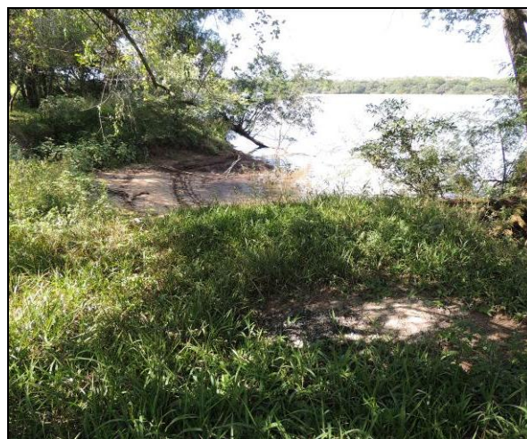
Foto 88: Vista da vegetação da margem, a jusante do ponto amostral E19A.