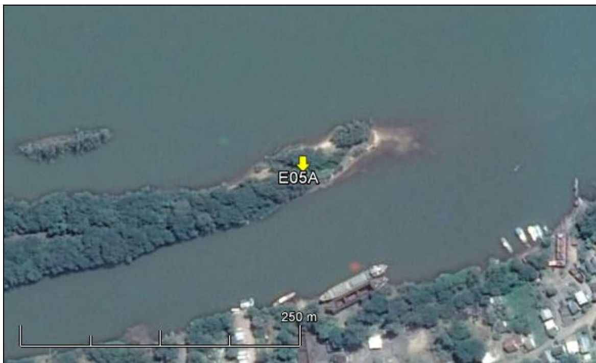
Figura 06: Imagem Google Earth, salientando o ponto amostral E05A (imagem de março de 2015, em situação de vazão normal do rio Jacuí).