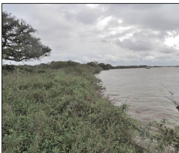
Foto 66: Vista da vegetação da margem, a montante do ponto amostral E15.