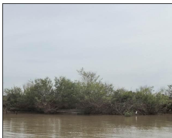
Foto 96: Vista da vegetação da margem, a jusante do ponto amostral E23.