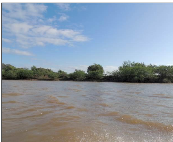
Foto 34: Vista da vegetação da margem, a montante do ponto amostral E09