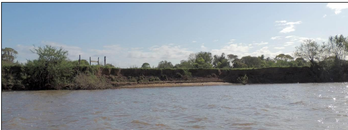
Foto 33: Vista geral da margem esquerda da Ilha dos Dornelles, em Charqueadas, na posição do ponto amostral E09.