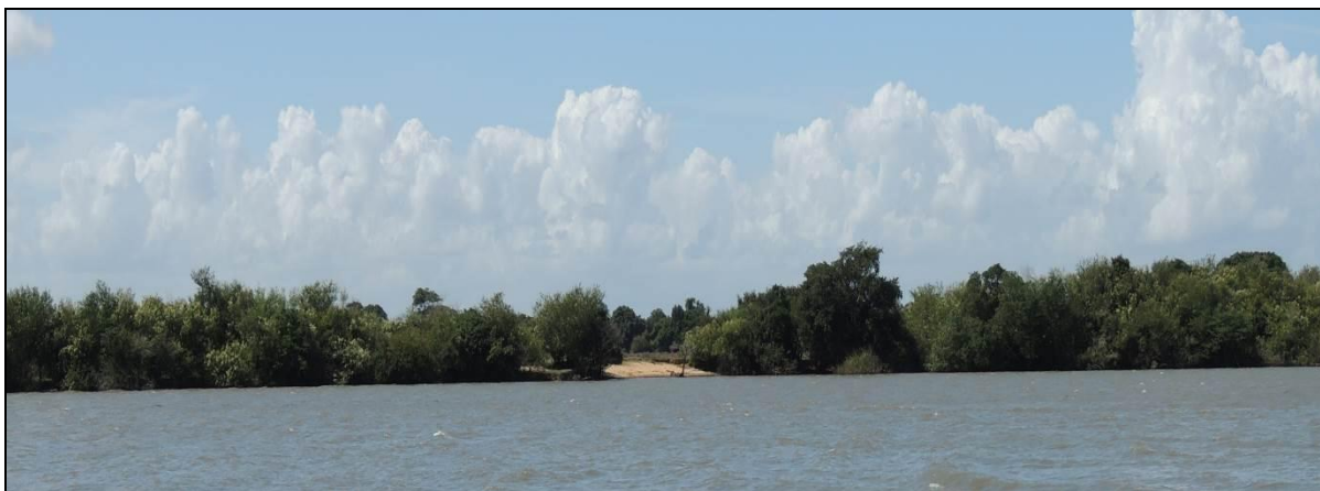
Foto 75: Vista geral da margem esquerda da Ilha do Araujo, em Triunfo, na posição do ponto amostral E16A.