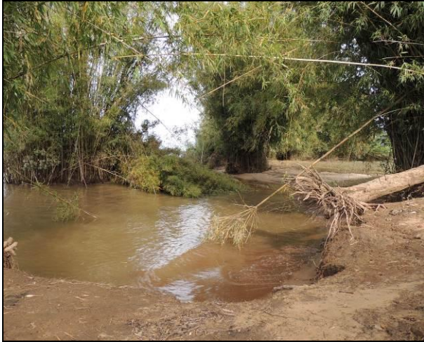
Foto 69: Vista da vegetação da margem, a montante do ponto amostral E16.