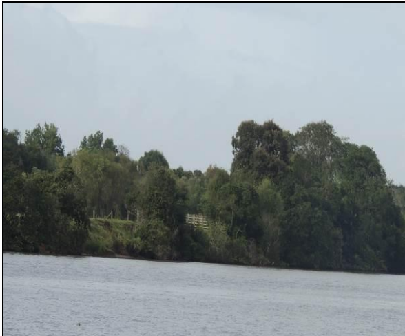
Foto 79: Vista da vegetação da margem, a montante do ponto amostral E17.