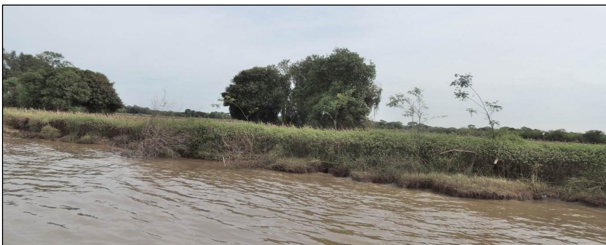
Foto 62: Vista geral da margem da ilha do Araujo, em Triunfo, na posição do ponto amostral E14B.

A mata ciliar é inexistente e não há indícios de regeneração natural. Observou-se o uso da faixa ciliar para lavoura. A APP está sendo utilizada intensivamente, com supressão total da vegetação original. Exemplares de médio e grande porte são suprimidos para dar lugar às lavouras e aumentar a área de campo para pecuária. Sendo assim, verifica-se sensível recuo das margens.