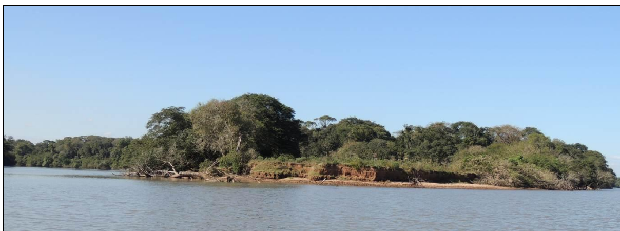
Foto 54: Vista geral da margem da ponta oeste da Ilha do Araujo, em Triunfo, na posição do ponto amostral E13.

Não houve alterações significativas em termos de composição e estrutura da vegetação ciliar e não há indícios de regeneração natural da mata ciliar. Observou-se o corte de raízes e de árvores na faixa ciliar e a presença do gado que vem beber água e se abrigar, o que aumenta a remobilização de material. É visível a ausência de exemplares arbóreos jovens, pois são consumidos pelo gado, ou então cortados. O local é usado como acampamento de verão, sendo suprimido todo o subosque, havendo grandes áreas de revolvimento do solo para captura de iscas (minhocas e corós). Verificou-se a queda de 3 exemplares de ingás ( Ingá uruguensis ) de grande porte. O pontal está visivelmente sendo erodido.