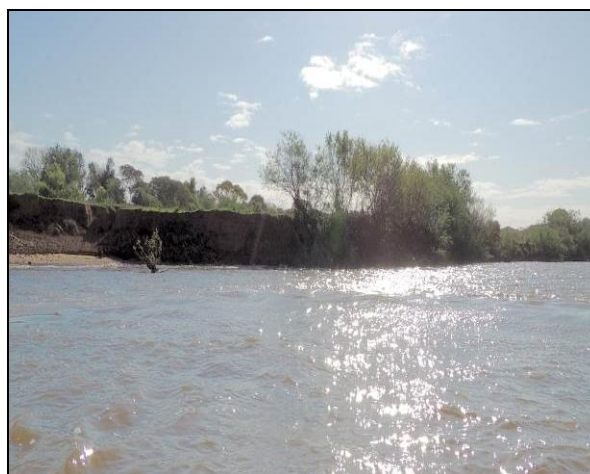
Foto 35: Vista da vegetação da margem, a jusante do ponto amostral E09.