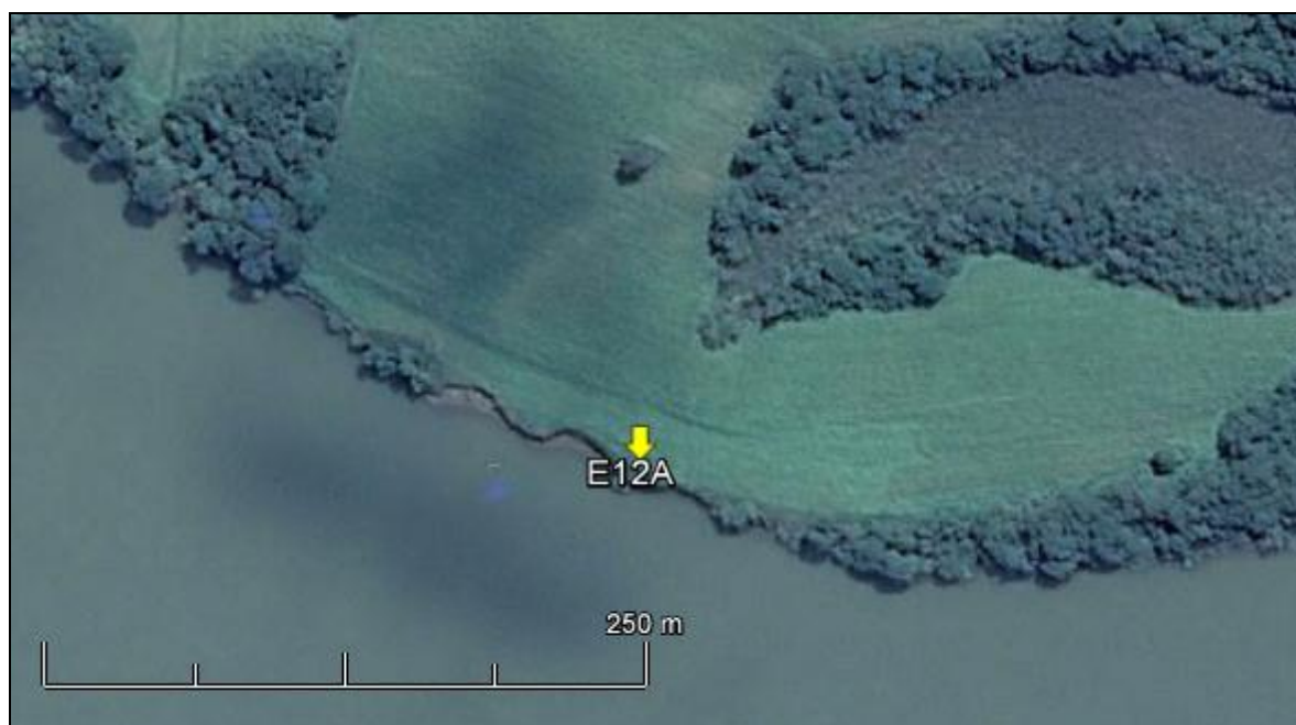
Figura 14: Imagem Google Earth, salientando o ponto amostral E12A (imagem de março de 2015, em situação de vazão normal do rio Jacuí).

ESPÉCIES PRINCIPAIS: Espécies das famílias Poaceae, Cyperaceae, Solanaceae e Asteraceae, com destaque para as rizomatosas Axonopus compressus (grama-missioneira) e Paspalum notatum (grama) rentes ao solo. Juntamente com as espécies: Solanum diflorum (peloteira), Senecio brasiliensis (flor-das-almas), Solanum atropurpureum (joá-roxo) e espécies dos gêneros Cyperus sp. (tiriricas), Sisyrinchium sp. e Desmodium sp. (pega-pega). As árvores e arvoretas estão representadas principalmente pelas espécies Pouteria salicifolia (sarandi-mata-olho), Ingá uruguensis (ingá-banana), Aloysia gratissima (erva-santa), Daphnopsis racemosa (embira), Doxantha unguis-cati sp (Unha-de-gato) e Bauhinia candicans (pata-de-vaca).