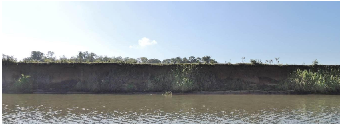
Foto 83: Vista geral da ponta oeste da Ilha do Fanfa, em Triunfo, na posição do ponto amostral E18B.

diferença em relação ao período anterior. A vegetação do talude é rarefeita, verificando-se o recuo das margens.