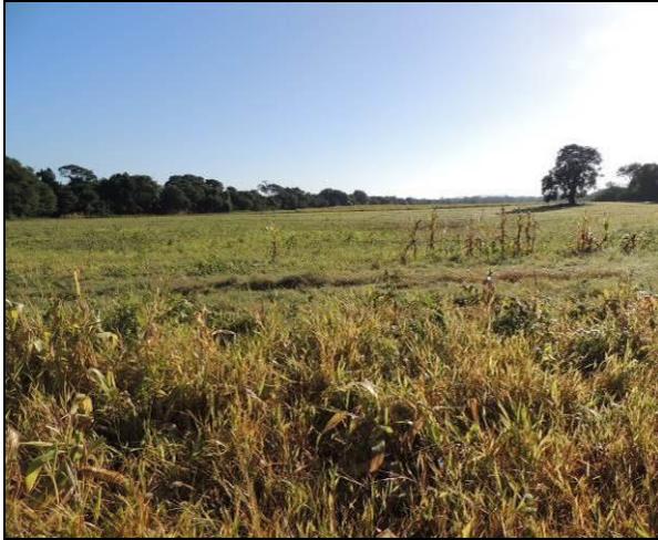
Foto 52: Aspecto do uso agrícola no interior da ilha, em área próxima.