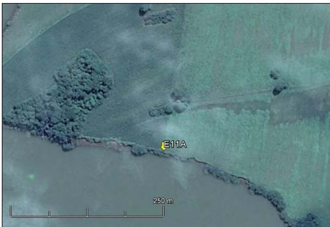
Figura 13: Imagem Google Earth, salientando o ponto amostral E11A (imagem de março de 2015, em situação de vazão normal do rio Jacuí).

ESPÉCIES PRINCIPAIS: Dentre as ervas predominam espécies das famílias Poaceae e Asteraceae, como Axonopus compressus (grama-missioneira), Cynodon dactylon (grama-seda), Vernonia nudiflora (alecrim-do-campo) e Baccharis articulata (carqueja), maricás ( Mimosa bimucronata ) e Pouteria sp. (sarandís) e Vegetação exótica: Brachiaria sp., carrapichão ( Xanthium strumarium L.).