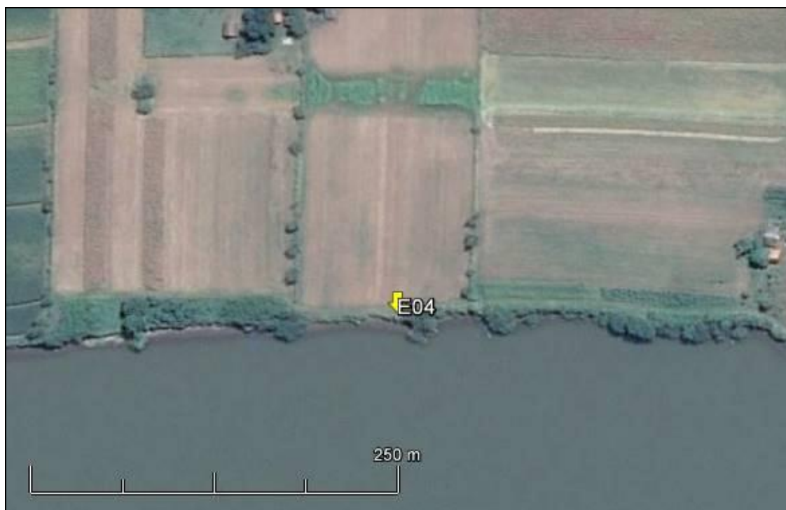
Figura 05: Imagem Google Earth, salientando o ponto amostral E04 (imagem de março de 2015, em situação de vazão normal do rio Jacuí).

ESPÉCIES PRINCIPAIS: Espécies pioneiras herbáceas, taquareiras e árvores isoladas.