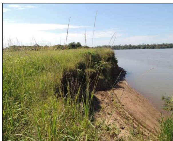
Foto 51: Vista da vegetação da margem, a jusante do ponto amostral E12A.