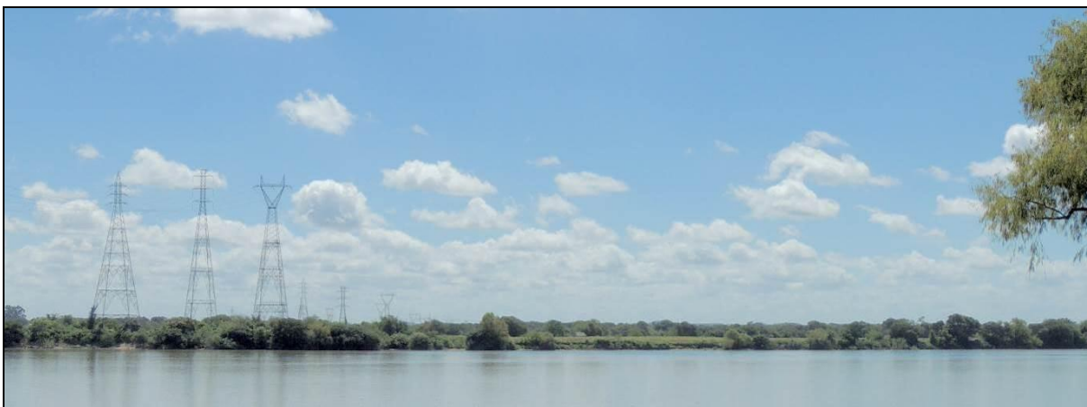
Foto 27: Vista geral da margem esquerda da Ilha das Cabras, em Charqueadas, na posição do ponto amostral E07A.