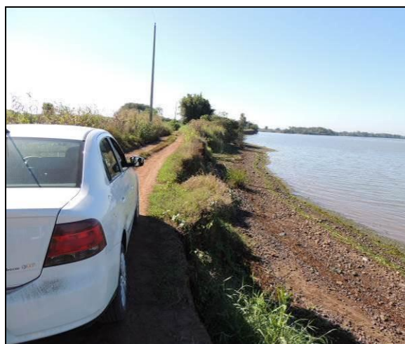
Foto 38: Vista da vegetação da margem, a jusante do ponto amostral E10A.