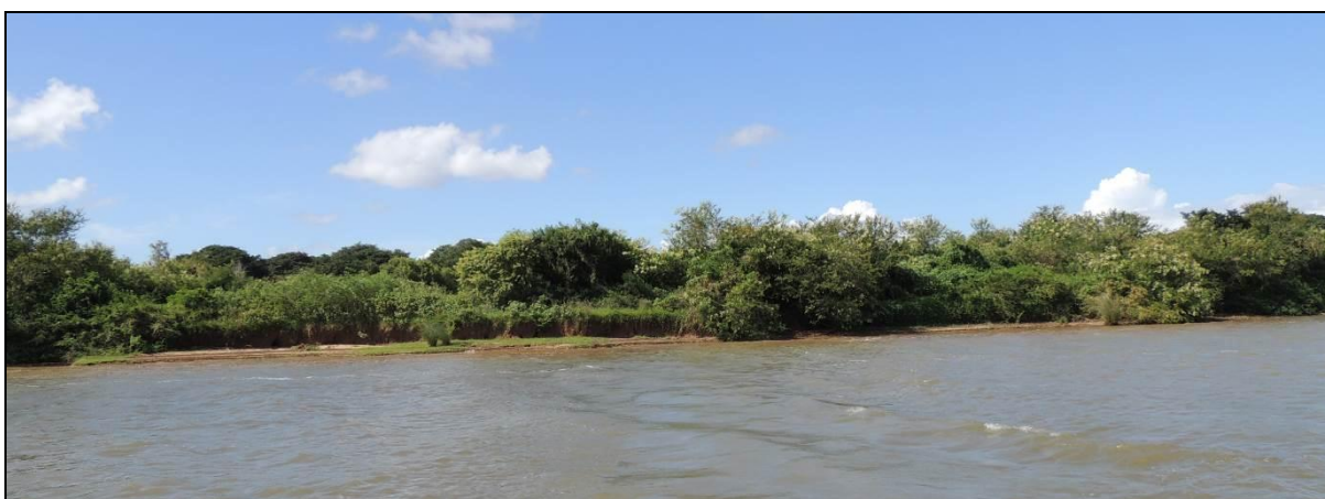
Foto 59: Vista geral da margem da ponta oeste da Ilha do Araujo, em Triunfo, na posição do ponto amostral E14A.

assim como o corte de raízes e de árvores na faixa ciliar e a presença do gado que vem beber água, o que aumenta a remobilização de material. A APP está sendo utilizada intensivamente, com supressão quase total da vegetação original. Exemplos de médio e grande porte são suprimidos para dar lugar às lavouras e aumentar a área de campo para pecuária. A vegetação de pequeno porte, está sendo eliminada pelo gado, cabras e porcos. Não há renovação e recuperação da mata ciliar, aparecendo barrancas nuas que, suscetíveis a ação das águas, avançam rapidamente.