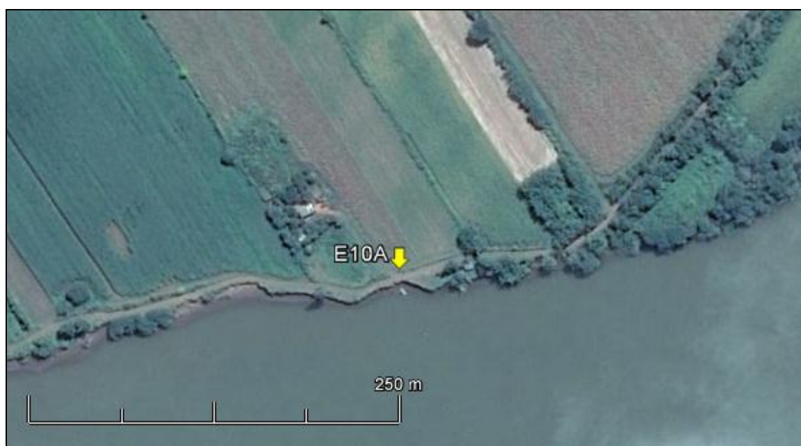
Figura 11: Imagem Google Earth, salientando o ponto amostral E10A (imagem de março de 2015, em situação de vazão normal do rio Jacuí).

ESPÉCIES PRINCIPAIS: Sida rhombifolia (guanxuma), Senecio bonariensis (flor-das-almas), Xanthium strumarium (carrapichão), Soliva pterosperma (roseta), Conyza bonariensis (buva), Ipomoea cairica (corda-de-viola), Leonurus sibiricus (santos-filho), Cynodon dactylon (grama-seda), Setaria geniculata (capim-rabo-de-raposa), Panicum rivulare (palha-branca) e Verbena bonariensis (quatro-quinas), Ingá uruguensis (ingá-banana), Pouteria salicifolia (sarandi-mata-olho), Sebastiania schottiana (sarandi) e Salix humboldtiana (salgueiro), Bambusa tuldoides (bambu), Morus alba (amoreira) e Ricinus communis (mamona).