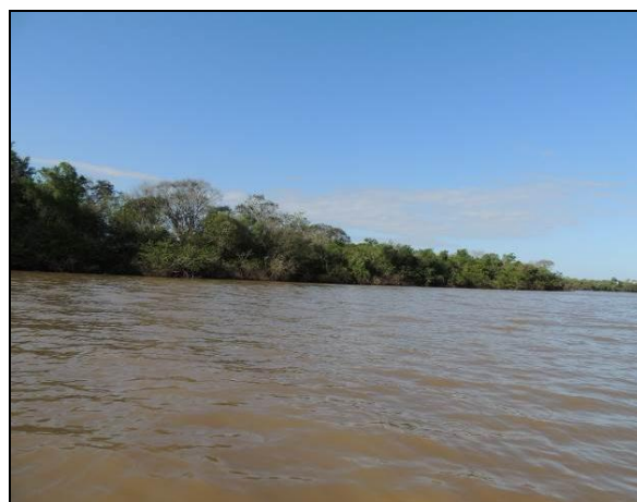
Foto 32: Vista da vegetação da margem, a jusante do ponto amostral E08.