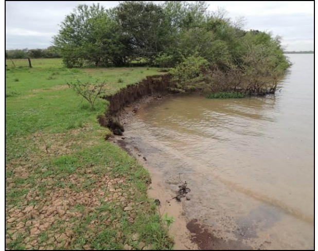
Foto 70: Vista da vegetação da margem, a jusante do ponto amostral E16.