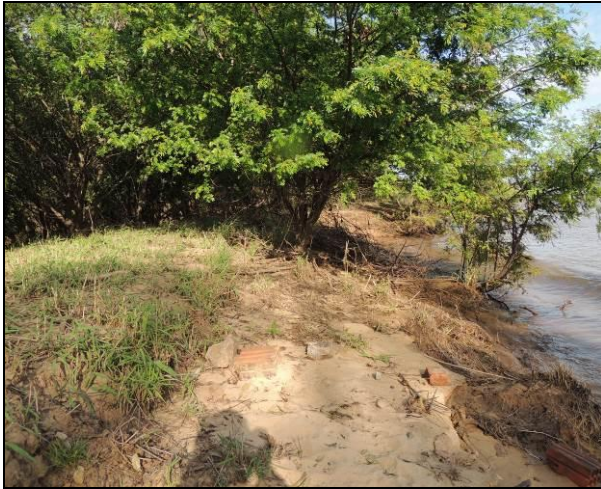
Foto 22: Vista da vegetação da margem, a montante do ponto amostral E05A.