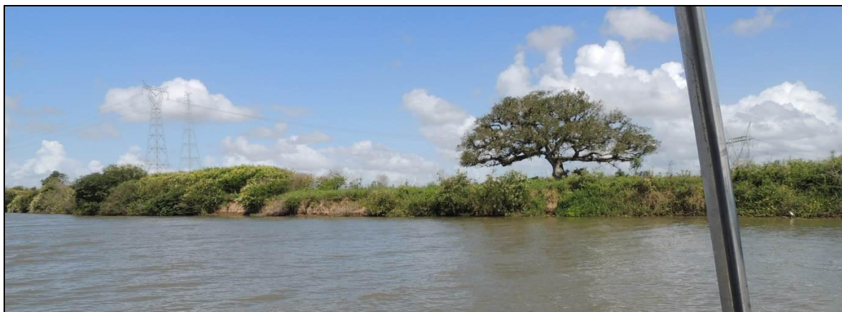
Foto 65: Vista geral da margem direita do rio Jacuí, fazenda São José, Charqueadas, na posição do ponto amostral E15.

Ao contrário do que foi observado no período anterior, não houve recuperação significativa da mata ciliar, apesar da mesma continuar isolada. De qualquer sorte, não foram observados significativos processos de erosão e recuo das margem. Observa-se que não ocorre a regeneração dos fragmentos remanescentes.