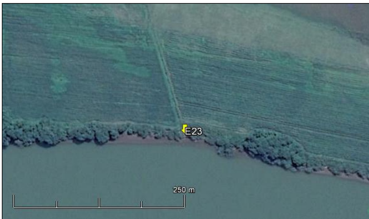
Figura 25: Imagem Google Earth, salientando o ponto amostral E23 (imagem de março de 2015, em situação de vazão normal do rio Jacuí).

ESPÉCIES PRINCIPAIS: Espécies arbustivas, como Mimosa bimucronata (maricá), Pouteria salicifolia (sarandís), Sebastiania sp (branquilha). Espécies das famílias Poaceae, Cyperaceae, Solanaceae e Asteraceae, com destaque para as rizomatosas Axonopus compressus (grama-missioneira) e Paspalum notatum (grama forquilha).