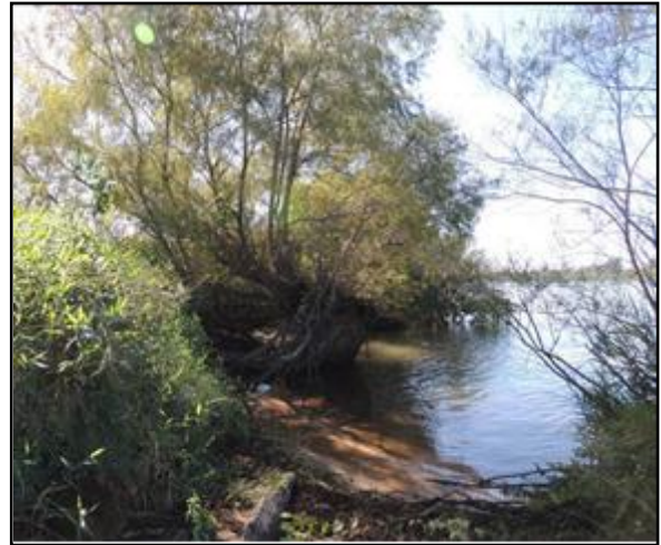
Foto 26: Vista da vegetação da margem, a jusante do ponto amostral E06A.