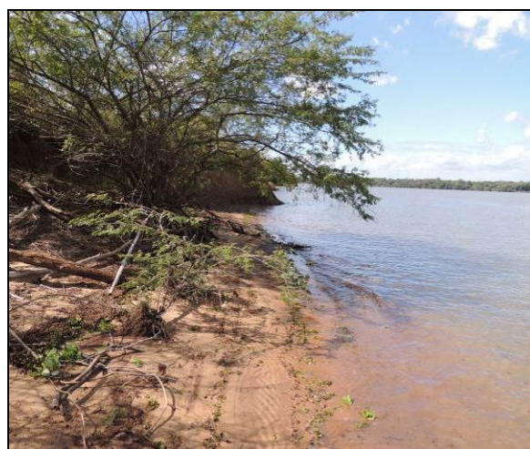
Foto 06: Vista da vegetação da margem, a jusante do ponto amostral E02A.