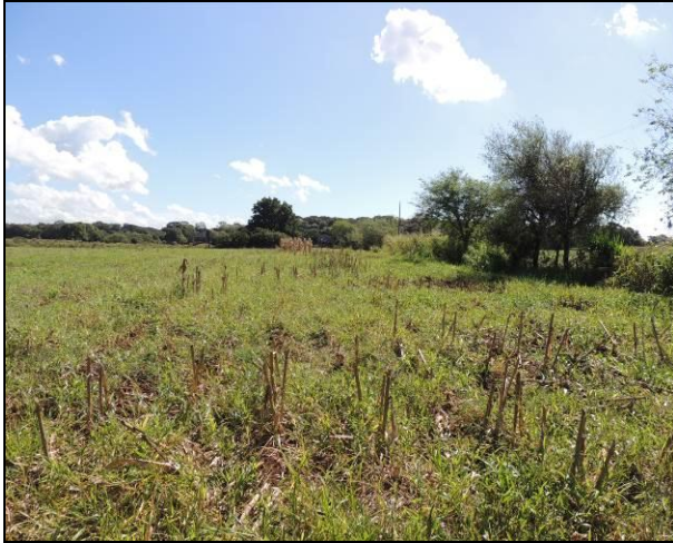
Foto 19: Aspecto da ocupação do interior da ilha, próximo ao ponto amostral E04.