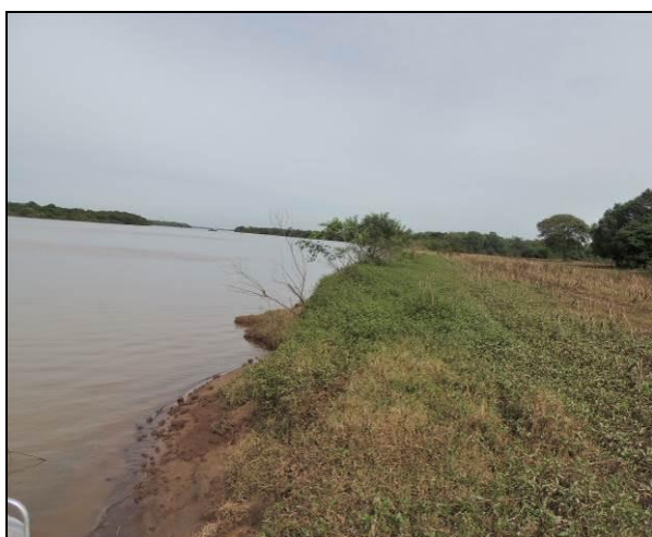
Foto 63: Vista da vegetação da margem, a montante do ponto amostral E14B.