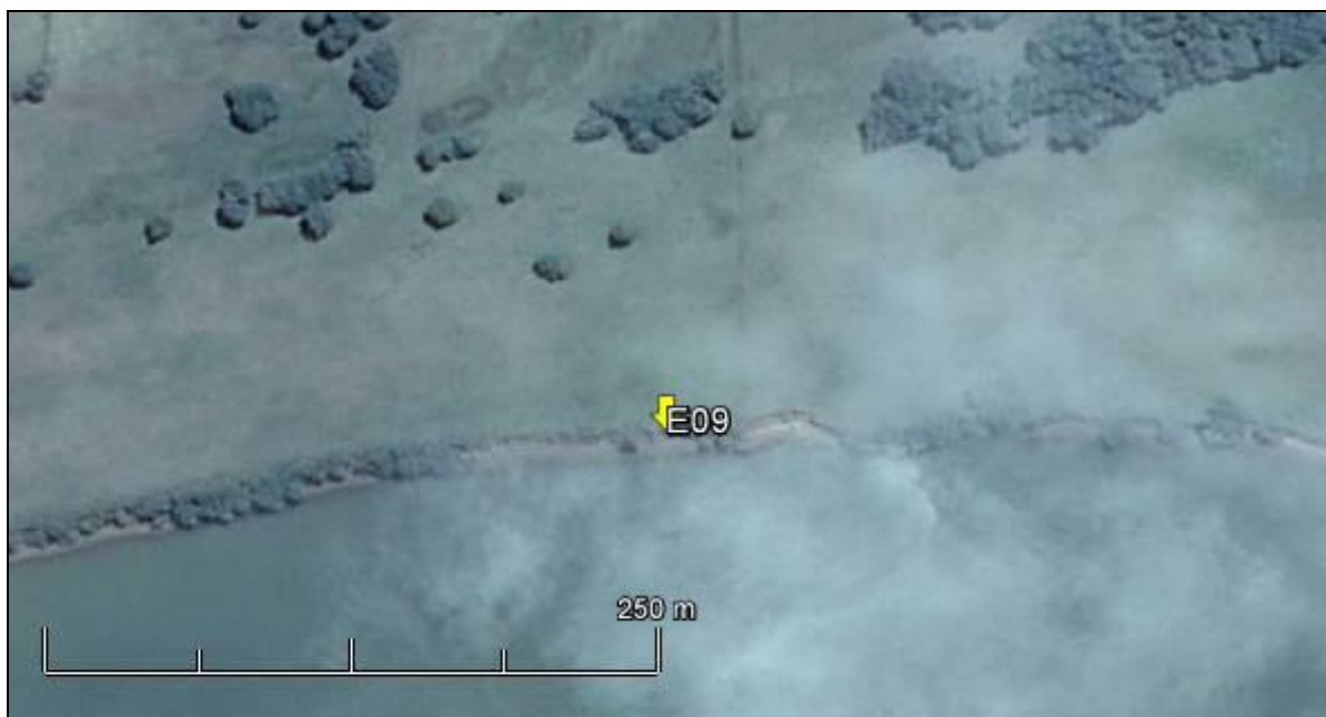
Figura 10: Imagem Google Earth, salientando o ponto amostral E09 (imagem de março de 2015, em situação de vazão normal do rio Jacuí).

ESPÉCIES PRINCIPAIS: Dentre as ervas predominam espécies das famílias Poaceae e Asteraceae, como Axonopus compressus (grama-missioneira), Cynodon dactylon (grama-seda), Elephantopus mollis (pé-de-elefante), Vernonia nudiflora (alecrim-do-campo) e Baccharis articulata (carqueja).