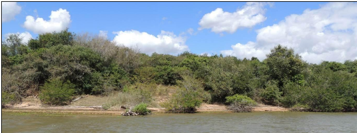
Foto 1: Vista geral da margem direita do Rio Jacuí, em Charqueadas, na posição em frente ao do ponto amostral E01.

Não houve alterações mensuráveis na estrutura e composição da mata ciliar. O levantamento qualitativo da vegetação não apresentou acréscimo de novas espécies.