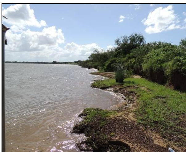
Foto 60: Vista da vegetação da margem, a montante do ponto amostral E14A.