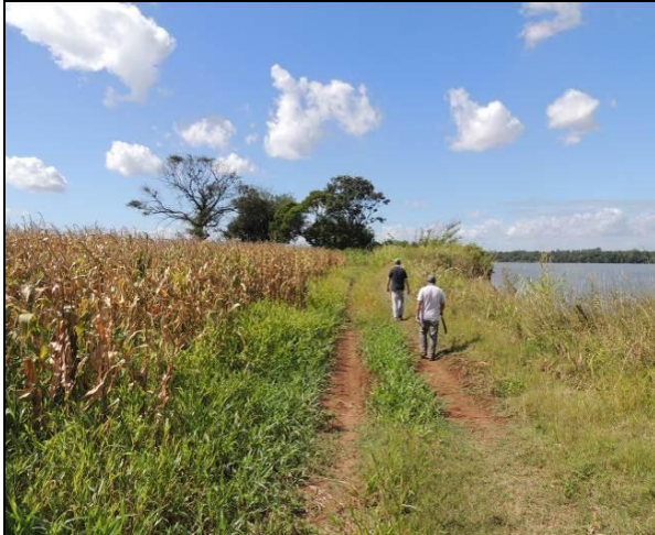
Foto 07: Aspecto da ocupação do interior da ilha, próximo ao ponto amostral E02A.