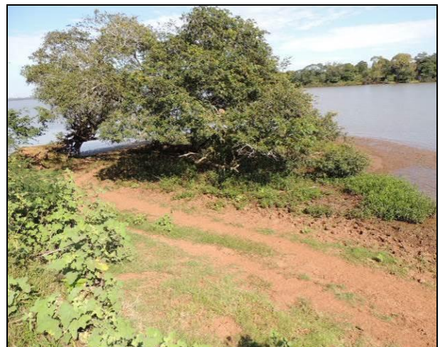
Foto 45: Detalhe do impacto causado pelo pisoteio do gado, gerando erosão das margens.