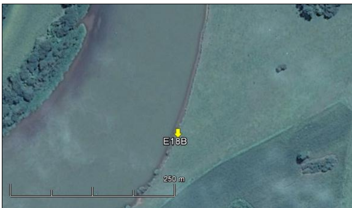
Figura 22: Imagem Google Earth, salientando o ponto amostral E18B (imagem de março de 2015, em situação de vazão normal do rio Jacuí).

ESPÉCIES PRINCIPAIS: Espécies das famílias Poaceae, Cyperaceae, Solanaceae e Asteraceae, com destaque para as rizomatosas Axonopus compressus (grama-missioneira) e Paspalum notatum (grama) rentes ao solo. Juntamente com as espécies dos gêneros Cyperus sp. (tiriricas), Sisyrinchium sp. e Desmodium sp. (pega-pega). Não existem espécies de árvores e arvoretas.