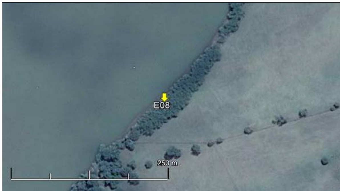
Figura 09: Imagem Google Earth, salientando o ponto amostral E08 (imagem de março de 2015, em situação de vazão normal do rio Jacuí).

humboldtiana ), além do sarandi-mata-olho ( Pouteria salicifolia ) e a unha-de-gato ( Acacia bonariensis ), além de exóticas como a amoreira ( Morus sp.) e eucalipto ( Eucalyptus sp.).