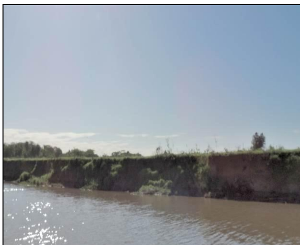
Foto 84: Vista da vegetação da margem, a montante do ponto amostral E18B.