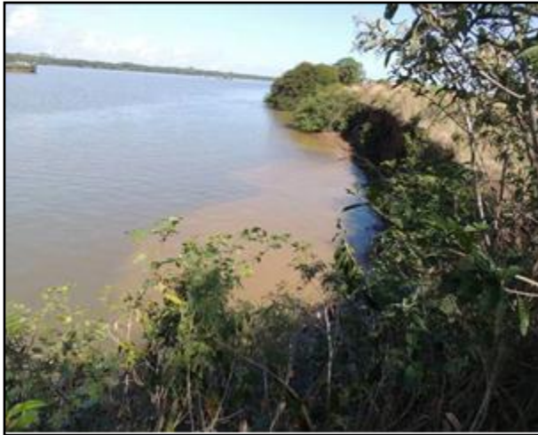
Foto 25: Vista da vegetação da margem, a montante do ponto amostral E06A.