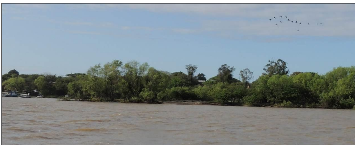
Foto 21: Vista geral da margem esquerda da Ilha D. Antônia, em Charqueadas, na posição do ponto amostral E05A.

Verificou-se que as cheias e a correnteza causaram impactos à vegetação e determinaram a formação de barrancos íngremes, com discreto recuo da margem.