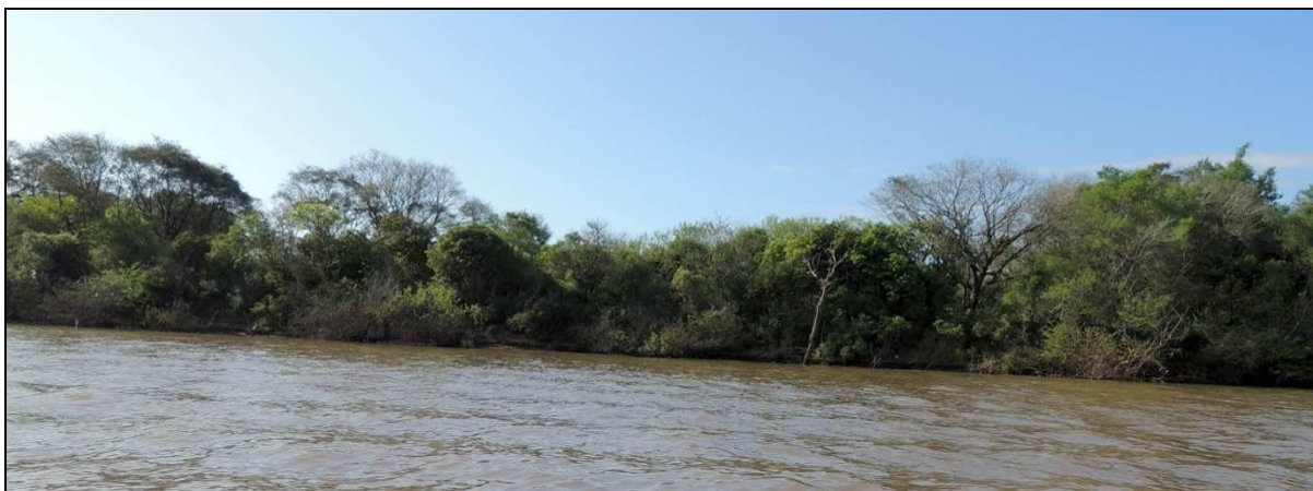
Foto 30: Vista geral da margem esquerda da Ilha dos Dornelles, em Charqueadas, na posição do ponto amostral E08.