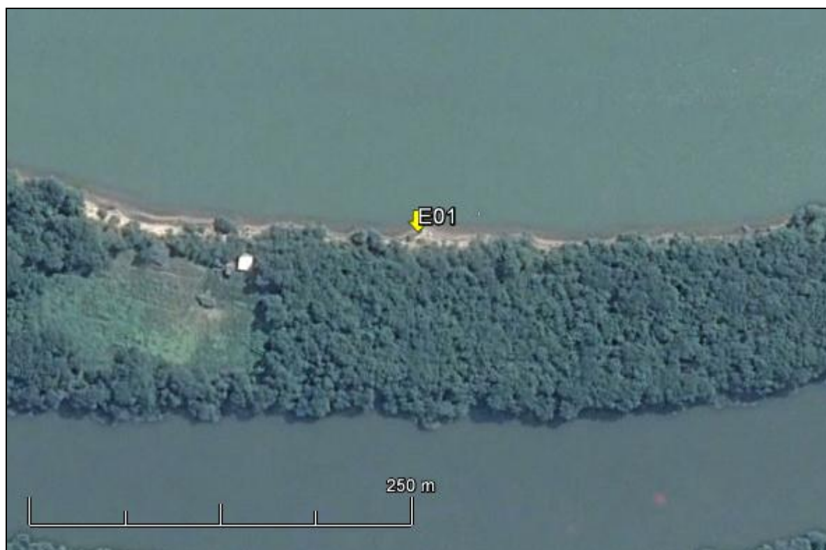
Figura 2: Imagem Google Earth, salientando o ponto amostral E01 (imagem de março de 2015, em situação de vazão normal do rio Jacuí)

ESPÉCIES PRINCIPAIS: Ingá uruguensis , Guárea macrophylla , Parapiptadenia rigida , Pouteria gardneriana , Pouteria salicifolia . Epífitos vasculares, principalmente bromeliáceas, cactáceas, gesneriáceas, piperáceas e pteridófitas.