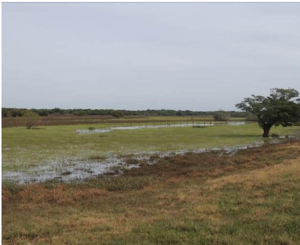
Foto 71: Aspecto da vegetação campestre no interior da ilha, onde se formam charcos em meio às lavouras.