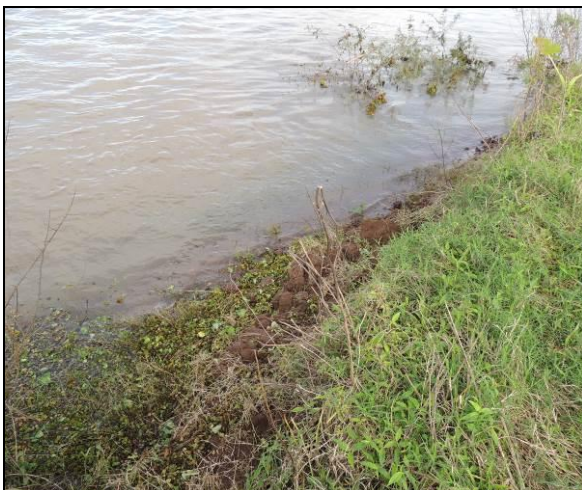
Foto 92: Vista da vegetação da margem, a montante do ponto amostral E21.