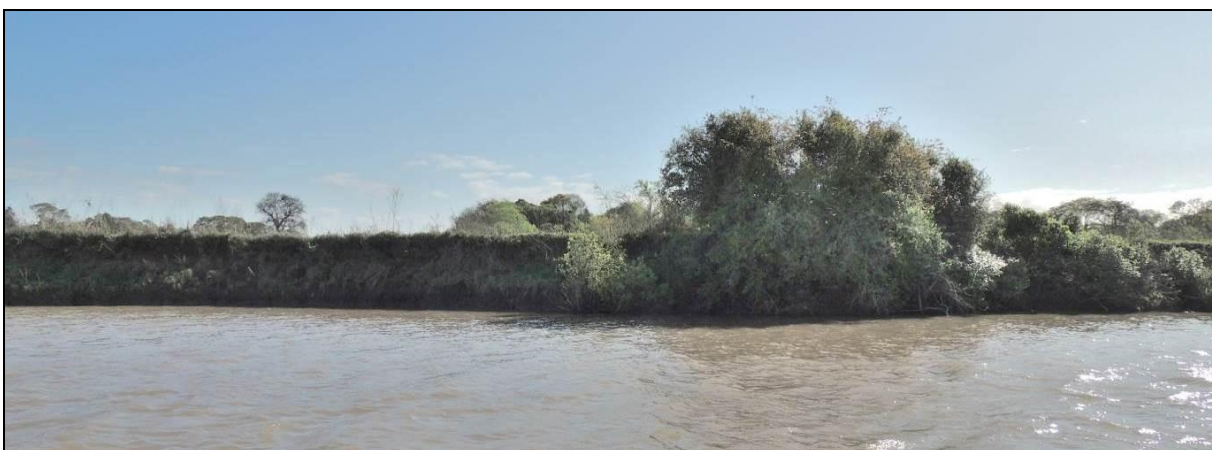
Foto 49: Vista geral da margem da ponta oeste da Ilha do Fanfa, em Triunfo, na posição do ponto amostral E12A.

Não houve alterações significativas em termos de composição e estrutura da vegetação ciliar e não há indícios de regeneração natural da mata ciliar. A APP está sendo utilizada intensivamente, com supressão quase total da vegetação original. Observa-se o intenso pisoteio do gado nos taludes marginais, inviabilizando a recuperação da vegetação ciliar.