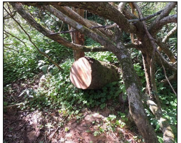
Foto 15: Exemplar de angico ( Parapiptadenia rigida ), serrado no interior da mata ciliar.