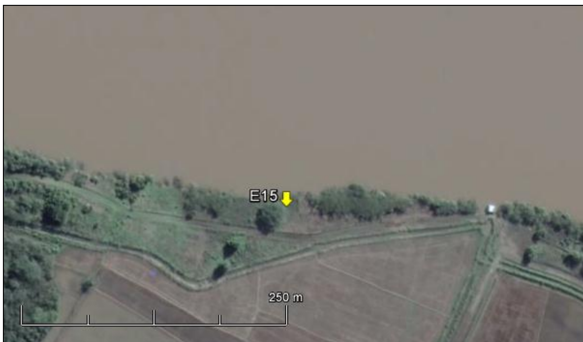
Figura 18: Imagem Google Earth, salientando o ponto amostral E15 (imagem de março de 2015, em situação de vazão normal do rio Jacuí).

ESPÉCIES PRINCIPAIS: Dentre as ervas predominam espécies das famílias Poaceae e Asteraceae, como Axonopus compressus (grama-missioneira), Cynodon dactylon (grama-seda), Elephantopus mollis (pé-de-elefante), Vernonia nudiflora (alecrim-do-campo) e Baccharis articulata (carqueja). Dentre as espécies arbóreas, ocorrem Mimosa bimucronata (maricá), Ingá uruguensis (ingá), Bauhinia candicans (pata de vaca), Pouteria sp (sarandí) e Acacia bonariensis (unha-de-gato).