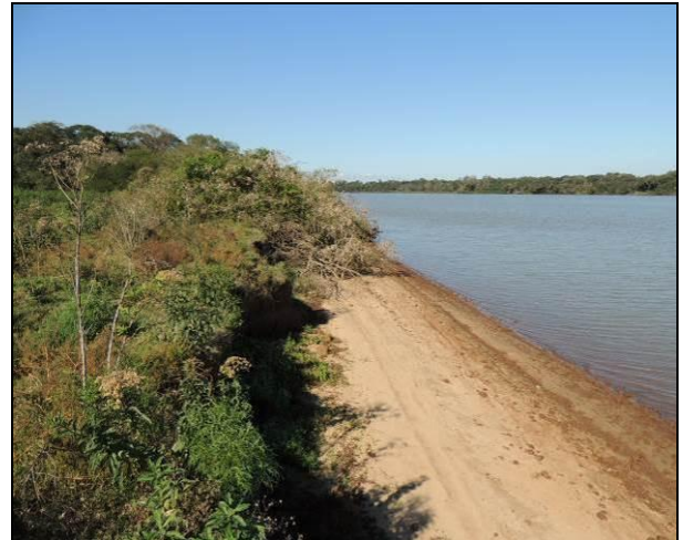
Foto 56: Vista da vegetação da margem, a jusante do ponto amostral E13.