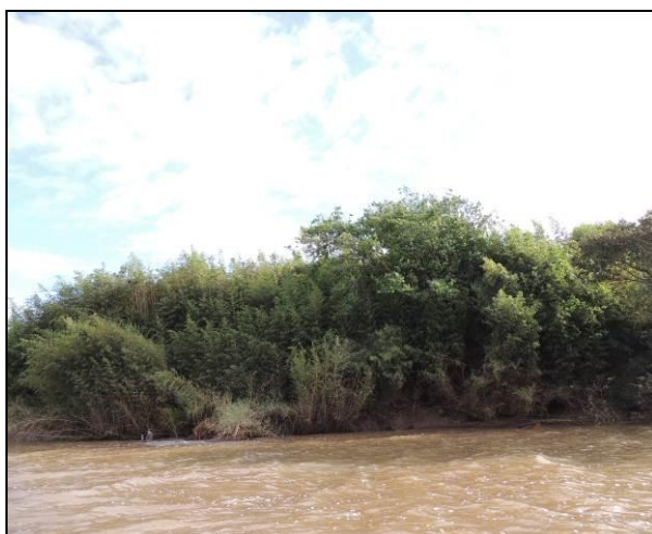
Foto 17: Vista da vegetação da margem, a montante do ponto amostral E04.