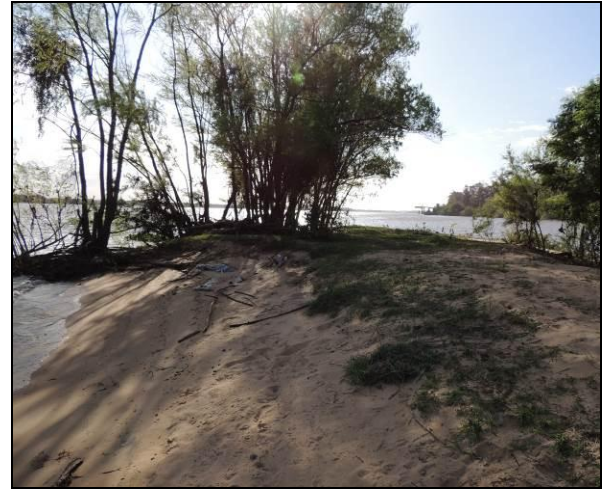
Foto 23: Vista da vegetação da margem, a jusante do ponto amostral E05A.