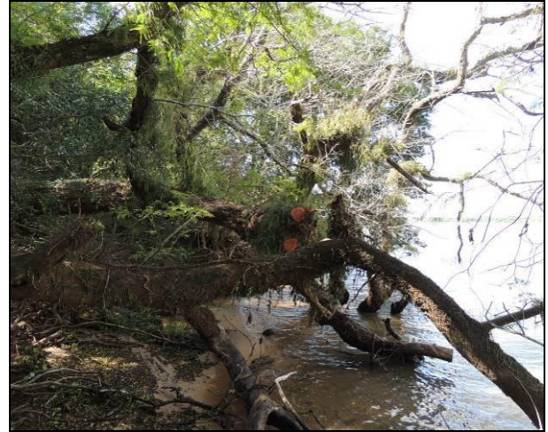
Foto 13: Detalhe da vegetação ciliar, observando-se árvores tombadas com abundância de epífitos, próximo ao ponto amostral E03.