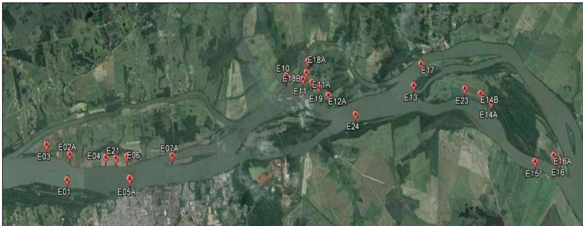
Figura 1: Imagem (Google Earth) onde estão locados os 24 pontos de monitoramento da vegetação ciliar e dos processos erosivos das margens.