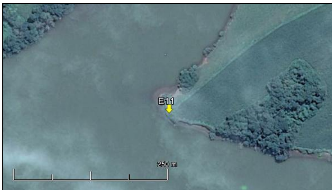
Figura 12: Imagem Google Earth, salientando o ponto amostral E11 (imagem de março de 2015, em situação de vazão normal do rio Jacuí).

ESPÉCIES PRINCIPAIS: Dentre as ervas predominam espécies das famílias Poaceae e Asteraceae, como Axonopus compressus (grama-missioneira), Cynodon dactylon (grama-seda), Elephantopus mollis (pé-de-elefante), Vernonia nudiflora (alecrim-do-campo) e Baccharis articulata (carqueja). Ocorrem também maricás ( Mimosa bimucronata ), Pouteria sp. (sarandís) e ingás ( Ingá uruguensis ), além de plantas exóticas como a brachiaria, carrapichão e amora.